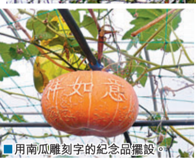
■用南瓜雕刻字的紀念品擺設。