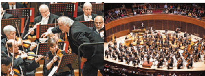
■備受全球最優秀的交響樂團追捧的唐納德·魯尼克斯 (Donald Runnicles) 擔任費城交響樂團2013中國巡迴演出的客席指揮。