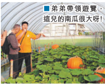
■弟弟帶領遊覽，這兒的南瓜很大呀！

每年端午節前後是南瓜的盛產期，農場總共設有六七條南瓜隧道，每一條的南瓜主題不同，品種也不盡相同，有東洋南瓜、西洋南瓜、美國南瓜及黑子南瓜，有最大的南瓜當然也有最小的，奇形怪狀又五顏六色的，似飛碟、佛手、平安大吉、葫蘆形、長滿疙瘩苦瓜形、毒蛇形還有顏色一半黃一半綠的可愛南瓜，還有可以刻上祝福字句的南瓜，可用來觀賞或買來當作裝飾。滿園都是奇形怪狀，什麼品種玩具瓜都有，太有趣了，吸引着許多遊客駐足觀賞，不論大人或小朋友進入南瓜隧道後自然變得都很開心。