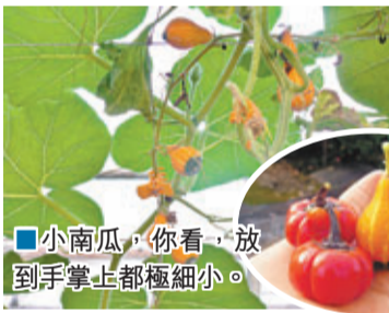
■小南瓜，你看，放到手掌上都極細小。

南瓜上刻字大家都好奇，林小弟告訴大家，想買刻字的南瓜需要事先訂購，因為刻字要從南瓜小時就要刻好了，然後慢慢長大就會自然形成，有店舖喜歡將刻字南瓜作擺設，如他們從相中看中了那一個可愛的南瓜，可以請園方在南瓜未成熟前刻字和繪畫，在等到約十多廿天，南瓜變成橘黃色，所刻的字體會浮出瓜皮，呈現出特殊造型與美麗圖案！一般可放上半年。原來南瓜上的字和美麗圖案其實是南瓜傷口留下的疤痕，彷彿是他們的「紋身」呀，那這算不算將我們的快樂建築在南瓜身上哩，哈哈！