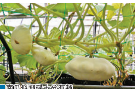
■南瓜似飛碟十分有趣