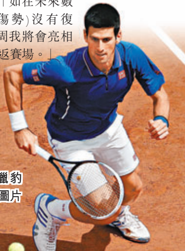
祖高域有獵豹影子？ 資料圖片