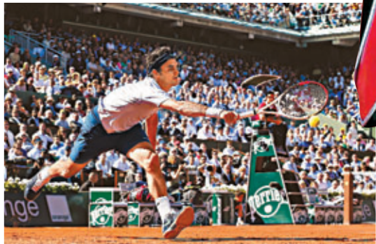
費達拿承認表現很差。