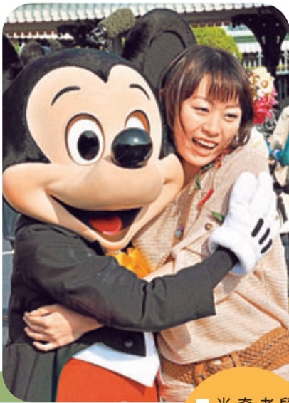
■ 米奇老鼠是最經典的卡通「人物」。資料圖片

在比利時一條小村中，尼路與爺爺相依為命，爺爺靠運送牛奶謀生，生活艱難但幸福。尼路喜愛繪畫，以此為樂。他在這段平淡的生活中偶爾遇上一頭畜牧犬，當時畜牧犬命危，尼路把它救回來，更成為自己的生活同伴，好不高興。可是好景不常，爺爺撒手人寰，尼路傷心之餘，也想到日後只能跟畜牧犬共度餘生，悲涼不已。可是，福無重至，禍不單行，因為不同命運交織，尼路最終走上絕路，結尾一幕講述尼路跟其愛犬一起在睡夢中離世，那是最冷一天，但尼路卻欣然溫暖，因為畜牧犬讓他安睡，以自己身體成為尼路的床單被鋪，不許寒夜任意騷擾。自己驕然回首，已數十年頭。但那對大頭的尼路鞋，至今記憶猶新，懷舊之餘，也有感傷。