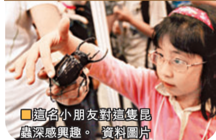
■ 這給小朋友對這隻昆蟲深感興趣。資料圖片

本港近年興起一股飼養另類寵物的潮流，如蟾蜍、甲蟲、蜥蜴、龍蝦等奇蟲異獸，擁躉不少，甚至明星化，成為一時佳話。寵物亦可成為不同時段的潮流指標，如美國從戰後至今有四大類流行狗種，分別是西班牙長耳猓狗、小獵犬、獅子狗及阿拉不多犬。而美國學者Hal Herzog指出，我們對寵物早已呈現兩股有趣趨勢，分別是「娃娃化」(Babyfication)和人類化(Humanization)。