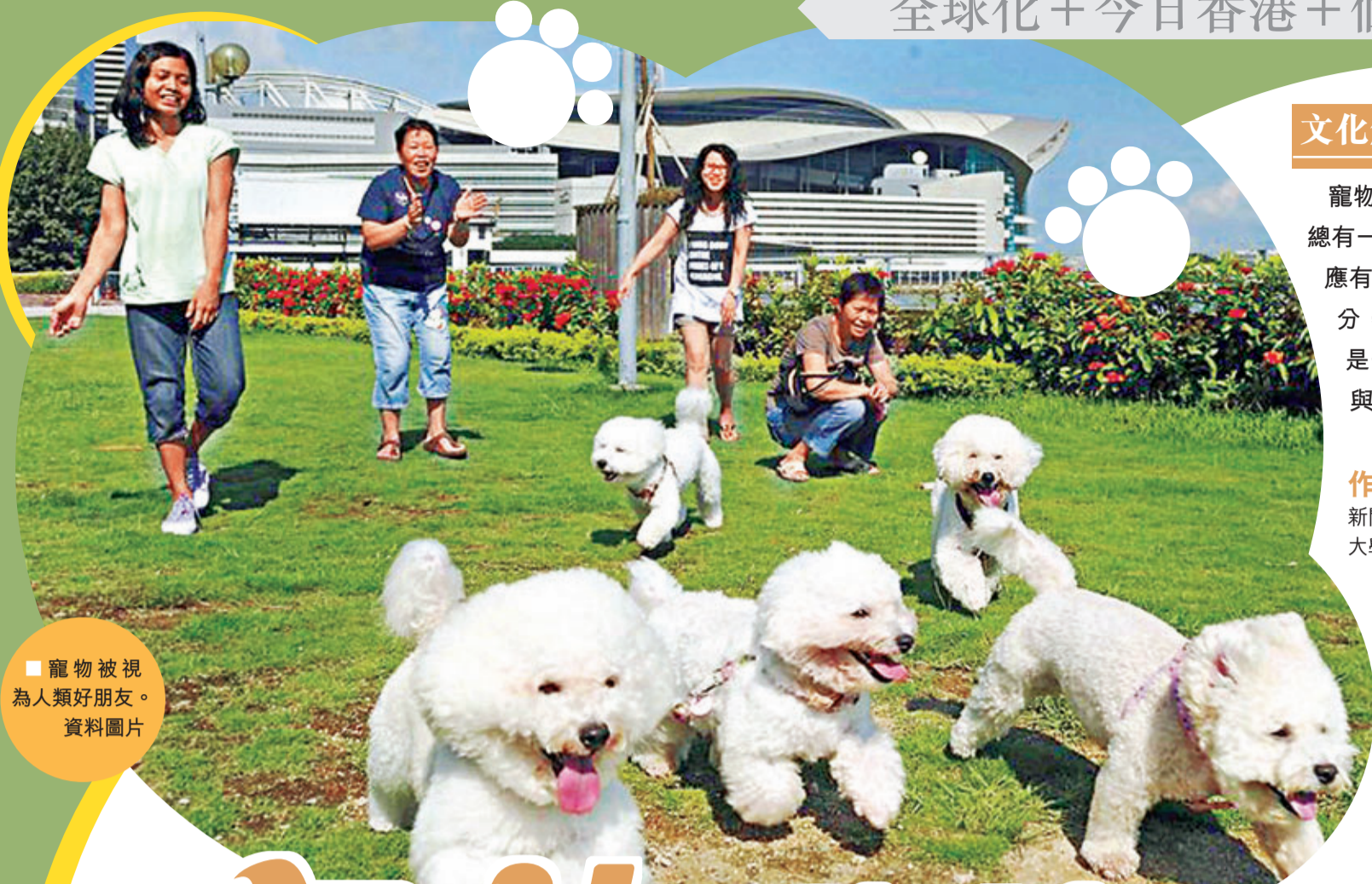
■ 寵物被視為人類好朋友。