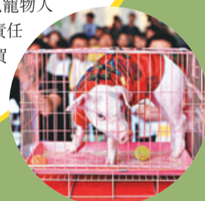
■ 連「迷你豬」也變成寵物。資料圖片

娃娃化 (Babyfication)： 以不同方法讓寵物更可愛，討人歡喜。正如Sony在1999年推出機械狗愛寶 (AIBO)，除以科技作招徠外，可愛也是別開生面的元素。如是，人類也把自己的慾望投射到寵物身上，讓其徹底成為我們的影子。 人類化 (Humanization)： 法國在19世紀已出現寵物人類化現象，當時中產階級迷戀寵物，寵物已不需要負責任何工作。目前美國70%飼養戶常跟寵物一起睡，66%買聖誕禮物給寵物，18%常為寵物打扮。有關人類與動物互動的論文，最重要是發表於1980年7月的Public Health Report，其開宗明義說明寵物對人類來說已不可或缺，同時有助醫治人類的情感創傷。