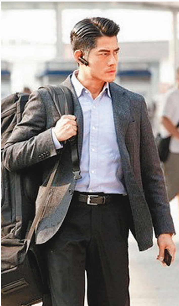
郭富城在電影《寒戰》內，這身Smart casual的造型，就符合商務休閒服的需要。

香港文匯報訊（記者蔡明曄）六月一到，熱浪逼人，於炎炎夏日，還要每天整套西裝示人，對很多返工人士來講，那種翳焗真的何其痛苦。不過如果打工仔要搏升職加入人工，就要一字寄之曰：「忍」。不但要忍怪獸上司，亦不止要忍難頂大客，同時要忍受炎熱。因為近日就有調查發現，有接近九成的人力資源部門主管表示，員工的衣着打扮，分分鐘影響到他們的晉升機會，打工仔真係唔易做。