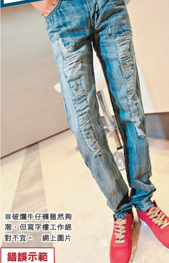
破爛牛仔褲雖然夠潮，但寫字樓工作絕對不宜。 網上圖片