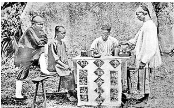
清人占卜測字的情景。

有兩個不同的結果，原因與中國傳統的數字觀念及問字者的落筆有莫大關係。其中一個元字用三筆寫成，「三」屬奇數，故生男；另一個元字以四筆寫成，「四」屬偶數，故生女。蓋因中國傳統陰陽學中往往以「天」、「陽」、「日」等觀念代表男性，又以「地」、「陰」、「月」等觀念代表女性。古人有「陽數」和「陰數」之說，《周易·繫辭》曰：「天一地二，天三地四，天五地六，天七地八，天九地十。天數五，地數五，五位相得而各有合。」又清人張必剛《潛元》云：「數從一而十，則奇數陽也，偶數陰也。」一、三、五、七、九是「天數」，「天」與「陽」相配，故奇數為陽數；二、四、六、八、十為「地數」，「地」與「陰」相配，所以偶數為陰數。由此推測生男生女，可見測字者心思縝密，並對中國傳統文化了如指掌。