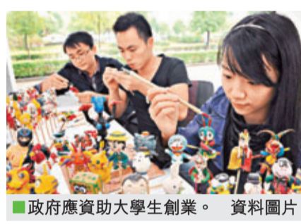
政府應資助大學生創業。 資料圖片

資金支持 激發創業精神：絕大多數大學生缺乏創業激情、創業培育、創業楷模，但政府的相關措施仍難起積極效果，如在最北端的黑龍江省，上年有4,360名畢業生實現自主創業，只佔該省當年畢業生總數的1.6%。而天津市近期公布的《天津市「高校科技創新工程」實施意見》，更是大開步加大對高校大學畢業生創業的支持力度。《實施意見》不但提到要對大學生創業提供資金支持，而且准許在校大學生休學創辦科技型中小企業(學籍最多保留兩年)，入駐市級