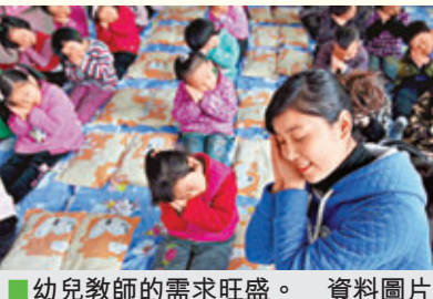
幼兒教師的需求旺盛。 資料圖片