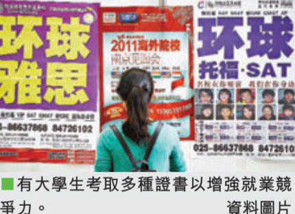
有大學生考取多種證書以增強就業競爭力。

輔修學位拓知識：現在越來越多大學生在畢業時持有兩個或以上學位。以華東師範大學為例，畢業時有近二分之一人取得雙學士學位。雙學位的修讀，