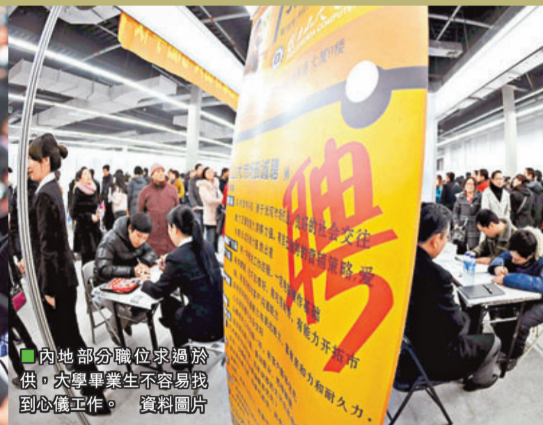
內地部分職位求過於供，大學畢業生不容易找到心儀工作。