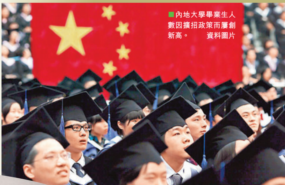
內地大學畢業生人數因擴招政策而屢創新高。

華東師範大學政治學系歷經60餘年的淬礪，為國家培養大批學界、政界與商界精英，並確立在全國政治學學科中的領先地位。香港《文匯報》與華東師範大學政治學系合作推出通識專欄，從多角度探究中國各方面的內政外交與國際關係的風雲變幻，為本港通識科高中生提供最實用的「現代中國」單元學習材料。