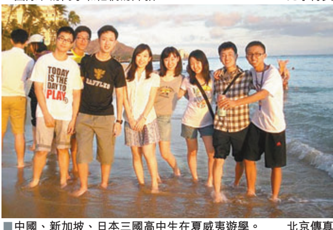
中國、新加坡、日本三國高中生在夏威夷遊學。 北京傳真