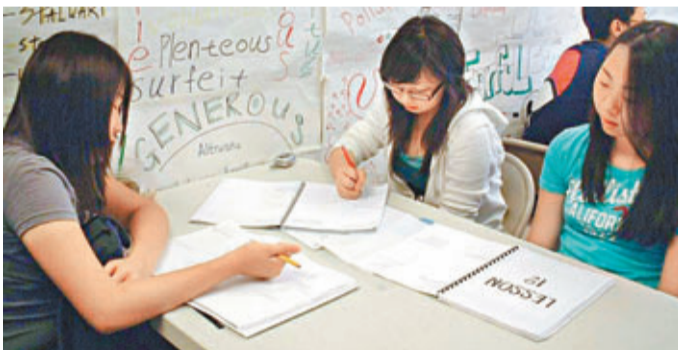
積極備戰的學生們。 網上照片