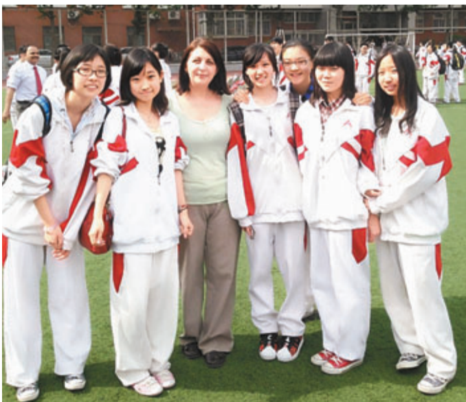
國際班的同學和他們的外教。 北京傳真