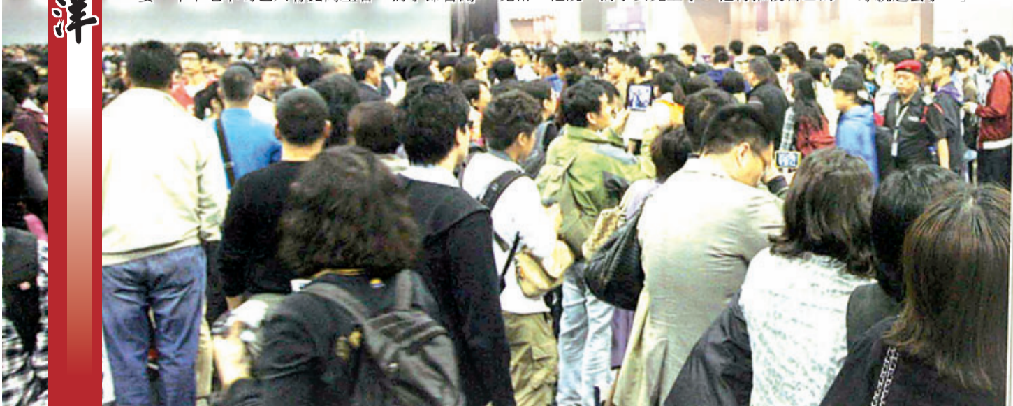
香港亞洲國際博覽館上月舉行SAT考試，開放3個展廳接待數千名考生，不乏內地考生身影。

購車升級計劃了。他告訴記者，上國際高中花費是普通高中的數十倍甚至百倍，他的家庭年收入在50萬元左右，女兒15萬元的高中花費，還可以承受。「當然，我本來準備今年把我的本田車換成平治的，但現在看來還是緩一緩吧。將來女兒去美國上大學，每年給她30萬，我們兩口子就相對吃緊些。但也就4年功夫，咬咬牙就過去了。」