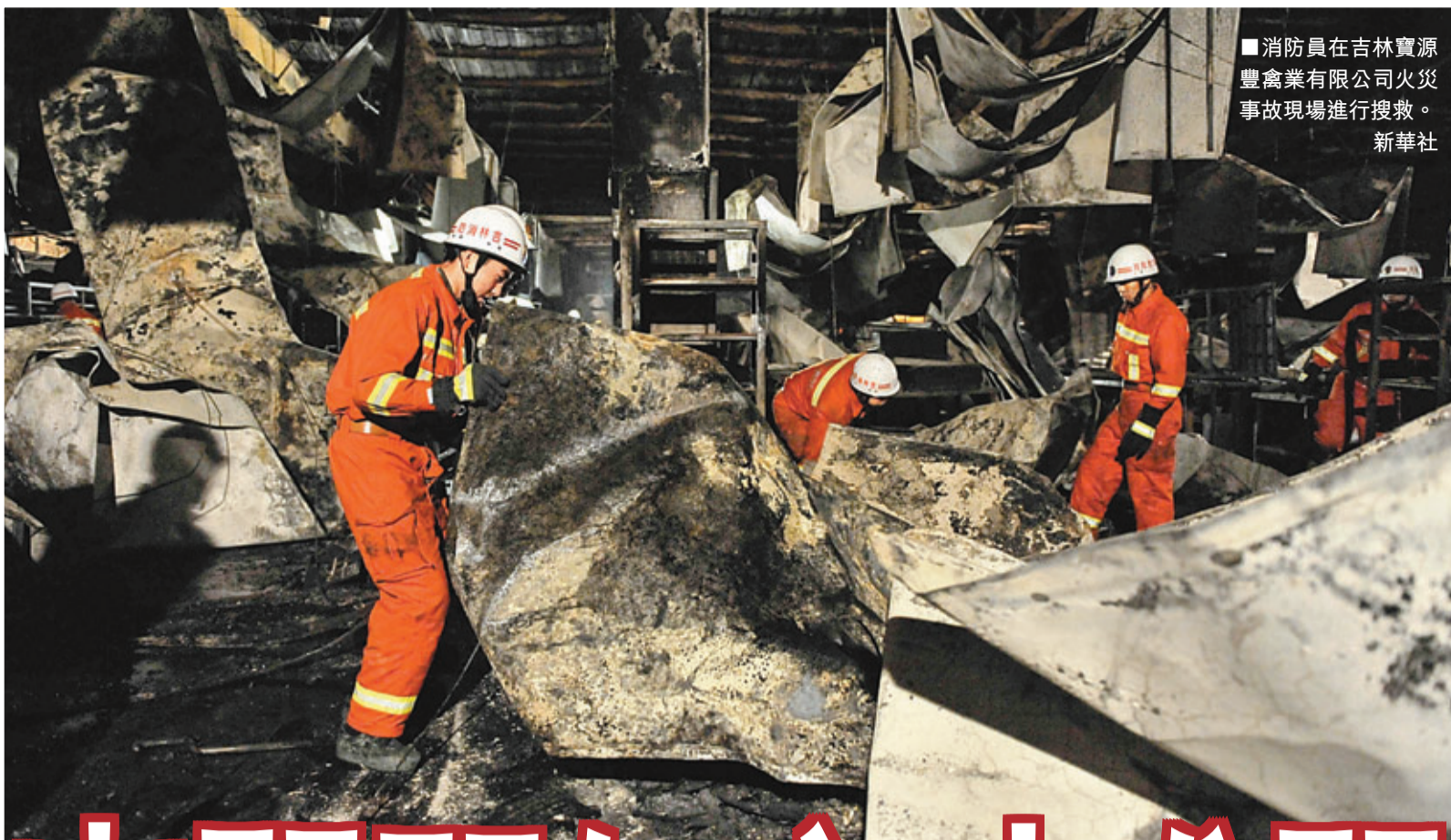
消防員在吉林寶源豐禽業有限公司火災事故現場進行搜救。