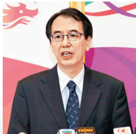
■公務員事務局局長鄧國威昨日下午代表港府公布公務員加薪方案。

香港文匯報訊(記者 鄭治祖) 香港特區政府公布2013/14年度公務員薪酬調整方案。公務員事務局局長鄧國威昨日下午公布,行政長官會同行政會議決定,低層薪金級別和中層薪金級別公務員的加薪幅度同為3.92%,高層薪金級別的公務員及首長級人員的加幅則為2.55%,並追溯至今年4月1日起生效。他強調,政府已考慮了公務員士氣和通脹等多方面因素,並按機制辦事,「希望同事理解這個決定」。當局已向4個公務員中央評議會的職方提出薪酬調整方案,在聽取職方意見後,會再交由行會作最後決定,並計劃於下月向立法會財委會申請撥款。