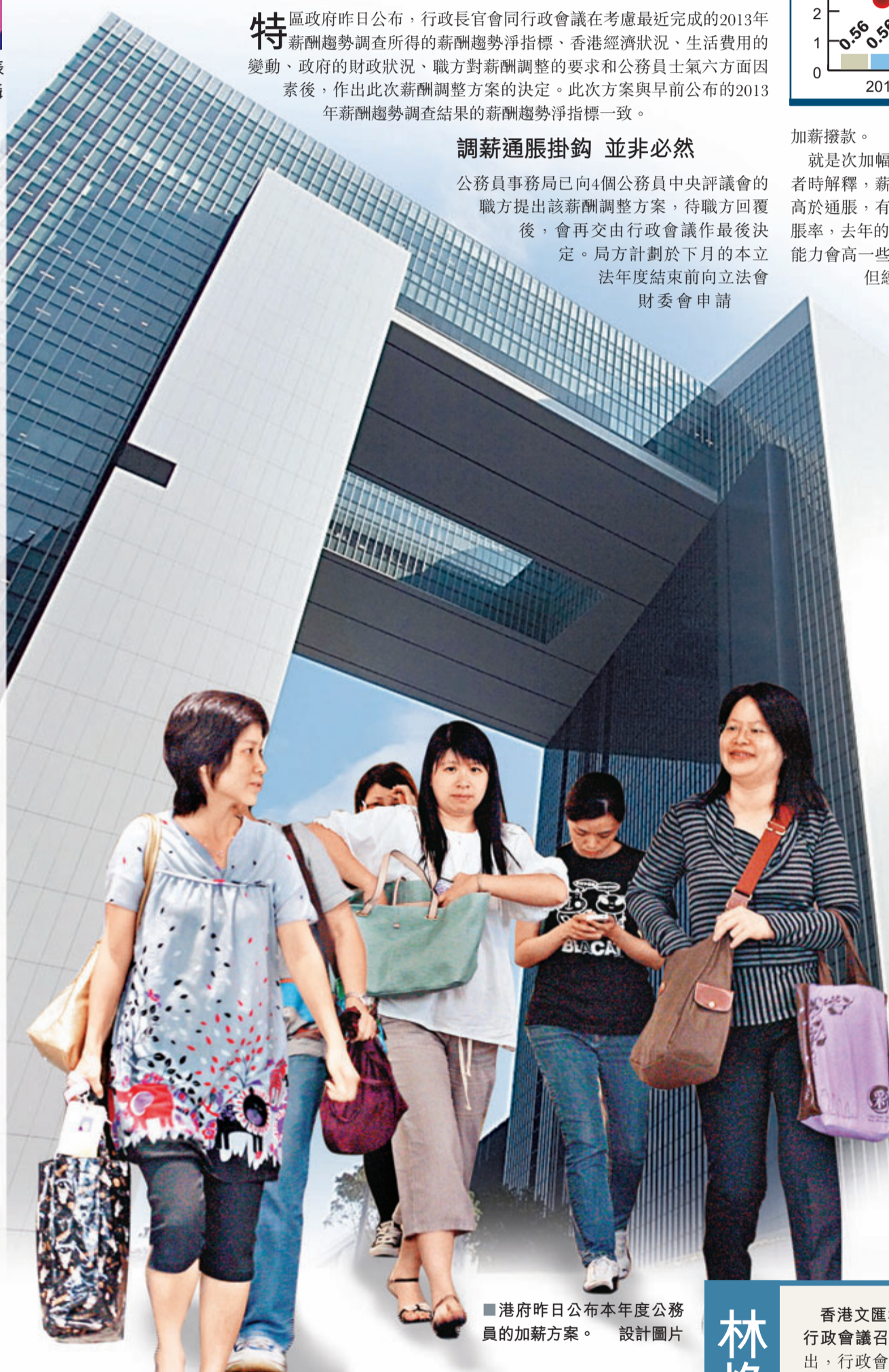
■港府昨日公布本年度公務員的加薪方案。設計圖片

就會否有機會再修改這個調整,發言人認為,這要視乎公務員團體是否能提出新的理據,但承認過往從未試過在公務員團體提交意見後,會改變行政會議對有關方案決定的情況。