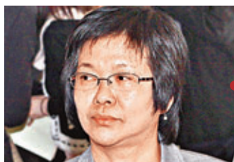
■利葵燕表明,會向當局提出反建議,希望公務員今年劃一加4.42%。