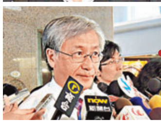
■郭志德表示,高級公務員的人工加幅遠低於通脹,公務員難以維持購買力,亦打擊士氣。