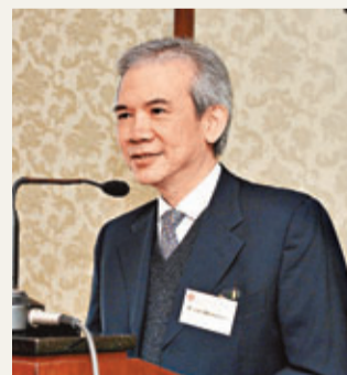
■行會召集人林煥光指出,行會作出公務員加薪方案的決定時已考慮過公務員團體的加薪論據。資料圖片

他解釋,薪酬趨勢調查委員會進行調查時,基本通脹是3.7%,因此是次加薪建議,中、低層薪金級別公務員加3.92%,已略高於通脹,而高層薪金級別公務員的加幅雖低於通脹,相信他們可以承受得到。