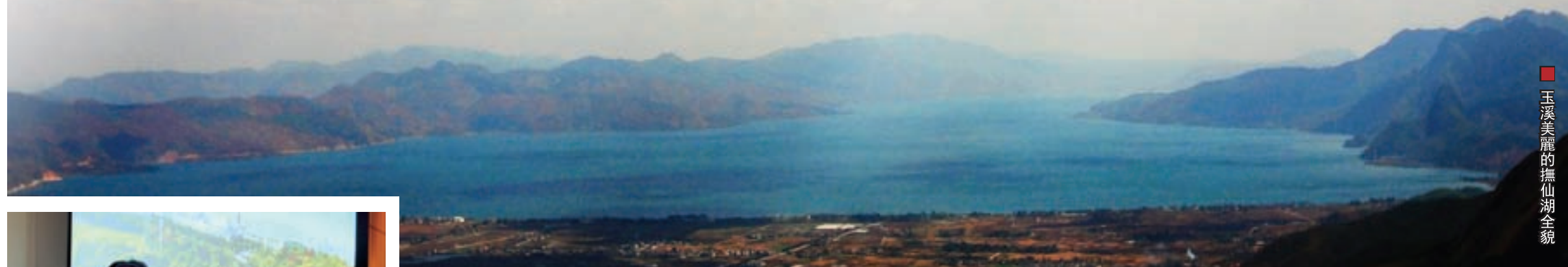
玉溪美麗的撫仙湖全貌