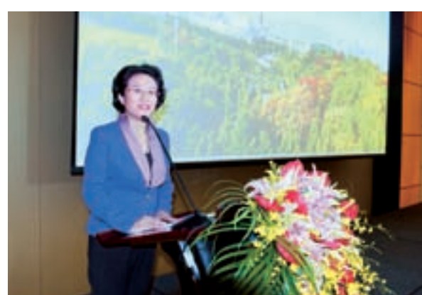
玉溪市市長饒南湖在玉溪推介會上作主旨推介

玉溪離昆明88公里，昆明離印度雷多1200公里，玉溪離南亞很遠，卻又很近。幾年前，玉溪企業已開始了走向南亞的探索，首屆中國南亞博覽會為玉溪帶來了千載難逢的機遇，南博會或將成為玉溪夢與南亞夢交織的地方。