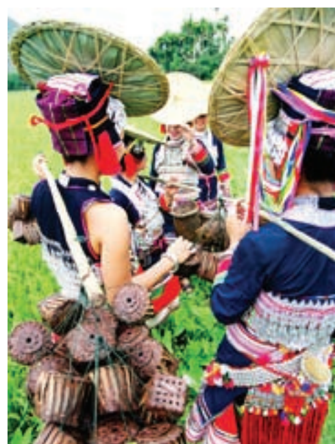
花腰傣是玉溪旅遊的名片，圖為正準備去趕花街的花腰傣姑娘。

玉溪是雲南高原特色農產品的重要出口和加工基地，出口量佔據了雲南的半壁江山，其中玉溪出口