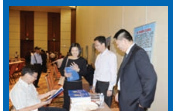
易門縣把優質陶土帶到了客商面前做交流

黃鎮說，沃森非常希望借助雲南橋頭堡戰略的實施和南博會的舉辦，為像沃森這樣的雲南企業與南亞企業的合作，打開一扇方便之門，提供一條合作的綠色通道。疫苗出口，除正常的手續外，還需交由進口國藥監部門審核批准，合格後方可上市銷售。如果僅是企業單方面申請，這一過程或會很漫長，若是雲南政府層面與南亞國家的政府藥監部門共同推動，效果會快捷得多。沃森極欲了解南亞國家對疫苗產品的需求情況，希望利用南博會這樣的政府平台接觸南亞，加快合作進程。