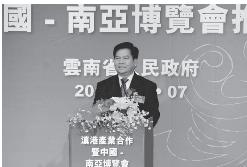
■ 6月6日首屆中國—南亞博覽會的召開，既是橋頭堡建設全面啟動三年的標誌，又是中國區域經濟合作的重要里程碑。圖為雲南省省長李紀恒在滇港產業合作暨中國—南亞博覽會推介會上發表主旨演講。

十 美麗 ：雲南通過大力實施七彩雲南保護行動，努力成為中國自然環境最好、生態保護最好的省份之一。