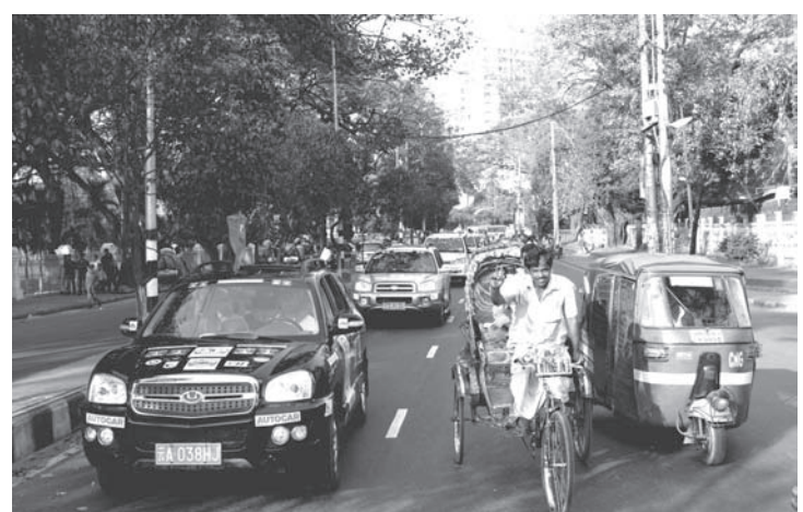
■ 2月22日至3月5日，孟中印緬汽車集結賽成功舉辦，集結賽完成了建設通向印度洋國際大通道的聯合道路考察。

首屆中國—南亞博覽會的召開，同時標誌着以西南開放為典型的中國沿邊開放迎來黃金期。報告指出：「首屆中國—南亞博覽會的舉辦，為中國的沿邊開放搭建了新平台，為雲南橋頭堡建設創建新陣地，為推動中國與南亞的共同繁榮注入了新動力。」段鋼表示：「橋頭堡建設與中國—南亞博覽會互為平台、相互促進，《雲南橋頭堡建設報告(2013)》的發佈也是對中國—南亞博覽會的重要獻禮，研究機構和媒體都有責任不斷精進，為中國—南亞博覽會添磚加瓦，為橋頭堡建設獻策獻智。」