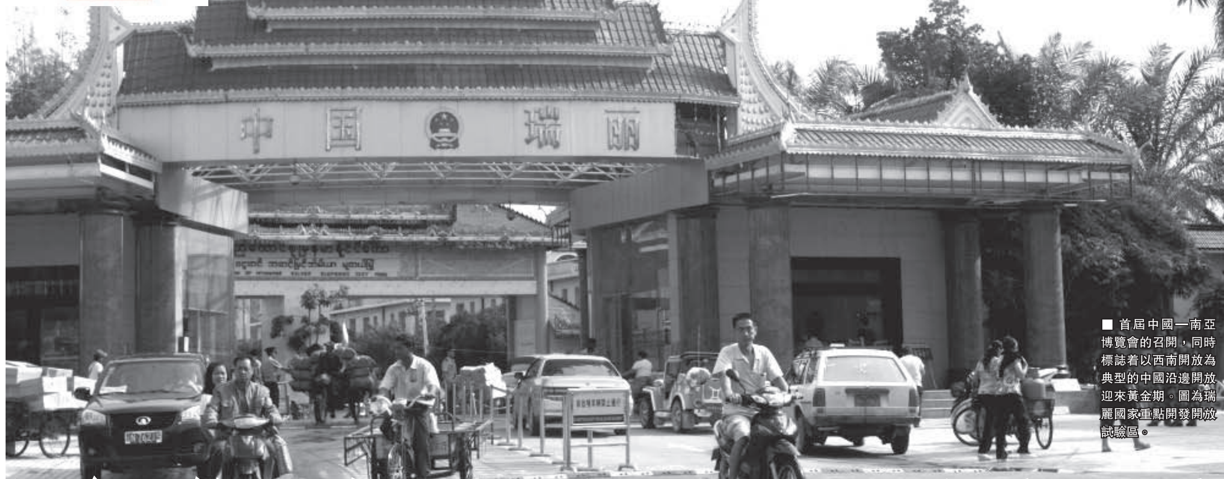
■ 首屆中國—南亞博覽會的召開，同時標誌着以西南開放為典型的中國沿邊開放迎來黃金期。圖為瑞麗國家重點開發開放試驗區。