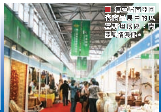
■ 第五屆南亞國家商品展中的巴基斯坦展區，南亞風情濃郁。