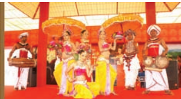
■ 首屆中國—南亞博覽會即將開幕，喜迎八方來客。圖為第四屆南亞商品展主題國斯里蘭卡的文藝表演。