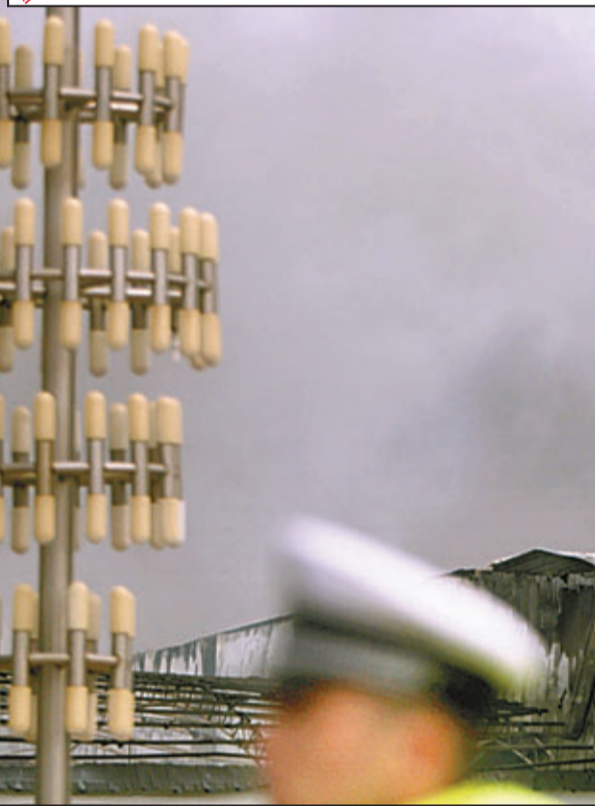
昨日,吉林德惠市米沙子鎮寶源豐禽業有限公司發生火災,造成至少119人死亡。