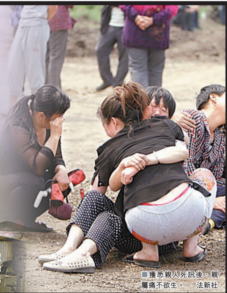
獲悉親人死訊後,親屬痛不欲生。

昨日上午6時06分,位於吉林省德惠市米沙子鎮的寶源豐禽業有限公司發生火災。記者冒著大雨到達現場,距離事發現場幾百米,警方就開始限制車輛通行。民眾聚集在警戒線外,希望獲悉親人消息,可是由於工人們上班後都將手機鎖在更衣室,所以就算僥倖逃生,一時間也無法聯繫親人,給傷亡統計工作帶來極大不便。