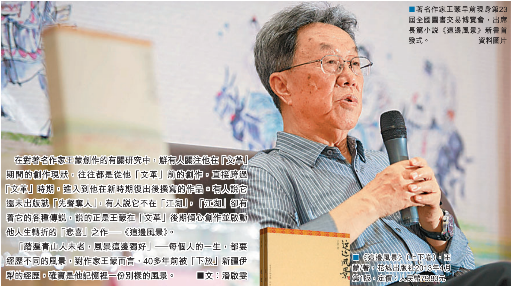
■著名作家王蒙早前現身第23屆全國圖書交易博覽會，出席長篇小說《這邊風景》新書首發式。

在對著名作家王蒙創作的有關研究中，鮮有人關注他在「文革」期間的創作現狀，往往都是從他「文革」前的創作，直接跨過「文革」時期，進入到他在新時期復出後撰寫的作品。有人說它還未出版就「先聲奪人」，有人說它不在「江湖」，「江湖」卻有着它的各種傳說，說的正是王蒙在「文革」後期傾心創作並啟動他人生轉折的「悲喜」之作——《這邊風景》。