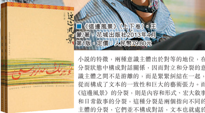
■《這邊風景》（上下卷）。王蒙/著，花城出版社2013年4月第1版。定價：人民幣79.80元

從藝術的角度來看，《這邊風景》裡的「政治敘事」和「日常生活敘事」呈現出一種分裂狀態，雖說作者的《組織部來了個年輕人》同樣都是分裂的文本，但《組織部來了個年輕人》的分裂是一個主體意識內部的分裂，按照複調