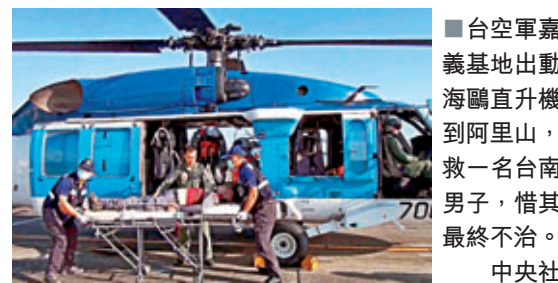
■台空軍嘉義基地出動海鷗直升機到阿里山,救一名台南男子,惜其最終不治。中央社