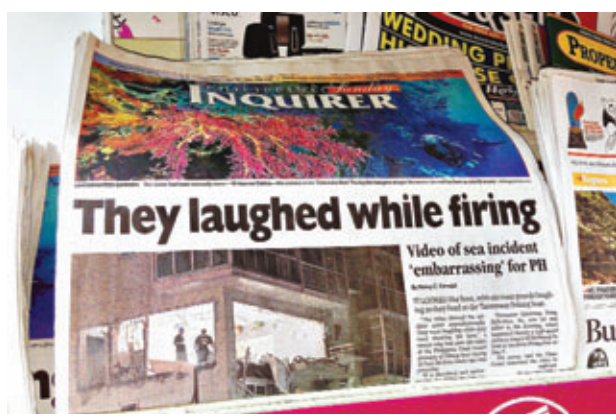
■《菲律賓每日詢問者報》以菲海防隊員一邊笑一邊開槍,作為昨日的頭版頭條報道。

香港文匯報訊 綜合媒體報道,菲律賓第一大報《菲律賓每日詢問者報》昨日在頭版頭條披露,菲海岸警衛隊隊員在追捕台灣漁船「廣大興28號」時竟然邊笑邊開槍。消息人士並抨擊海防隊員有失職業道德,讓菲律賓蒙羞。