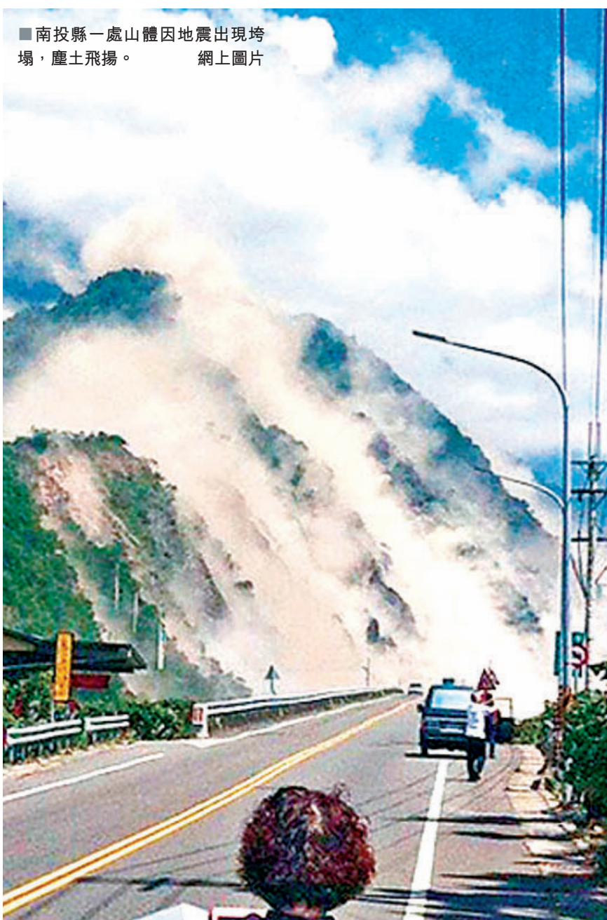
■南投縣一處山體因地震出現垮塌,塵土飛揚。

台「氣象局」表示,這回地震是受1999年「9·21」大地震的「應力效應」影響,14年前的能量累積到現在釋放,要調整回9·21前的平衡狀態。