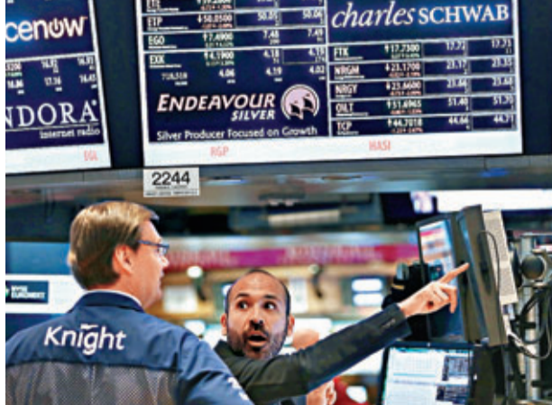
■美股下跌，交易員表現驚訝。法新社

財政部前日宣佈暫停再投資一家退休基金，以節省開支，避免債務超出上限。有指措施將為政府提供1,600億美元(約1.24萬億港元)資金緩衝。 ■路透社/法新社