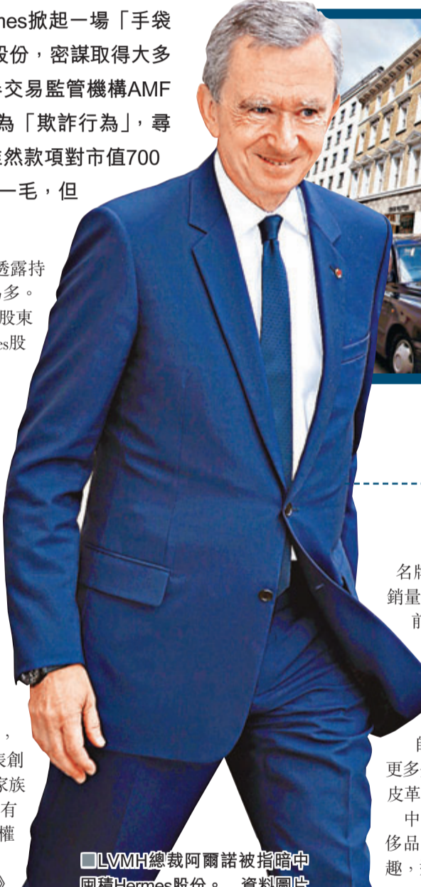
■LVMH總裁阿爾諾被指暗中囤積Hermes股份。資料圖片