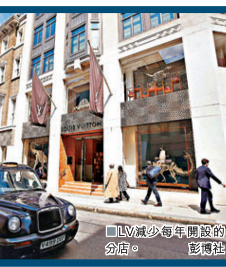
■LV減少每年開設的分店。彭博社