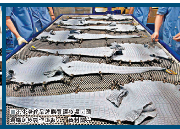
■不少奢侈品牌購買鱈魚場。圖為鱈魚皮製作工廠。