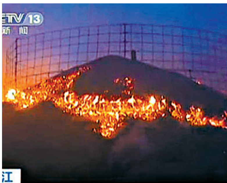
■糧倉火災現場。 電視畫面

香港文匯報訊 綜合報道，黑龍江中儲糧林甸直屬庫前日下午發生火災，據火災事故應急指揮部消息，火災事故導致78個儲糧囤表面過火，儲量4.7萬噸。其中玉米囤60個，儲量3.4萬噸；水稻囤18個，儲量1.3萬噸。目前火災已經被撲滅，無人員傷亡，經濟損失和火災原因正在調查中。