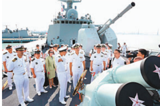
■哈尼上將參觀衡陽艦。

香港文匯報訊 據中國海軍網報道，日前，美國海軍太平洋艦隊司令塞爾西·哈尼上將，在南海艦隊機關拜會了南海艦隊司令蔣偉烈。哈尼上將在蔣偉烈中將的陪同下檢閱了儀仗隊，並合影留念。