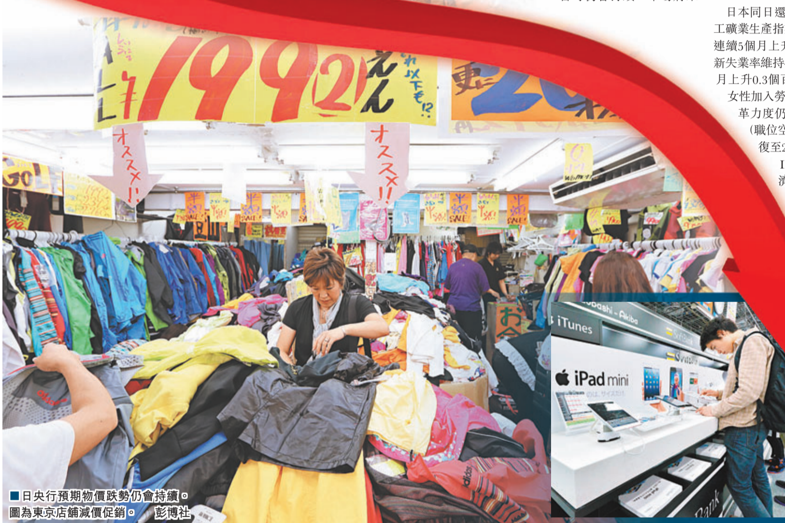
■日央行預期物價跌勢仍會持續。圖為東京店舖減價促銷。