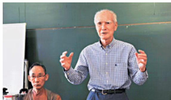
日本前首相村山富市(右)。中新社