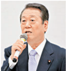
日本生活黨主席小澤一郎。

小澤還表示，安倍首相領導的自民黨好不容易在眾議院獲得了過半數以上的議席，是不會選擇解散的。下一次的眾議院大選應該在3年後，與參議院選舉會同時進行。那個時候，可能會是實現政權交代的好時候。