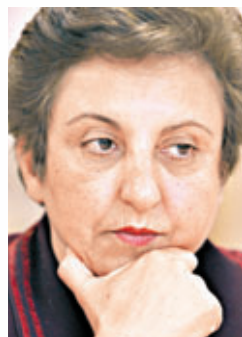
伊朗的希林·伊巴迪

香港文匯報訊 據日本共同社報道，因禁止地雷運動在1997年獲得諾貝爾和平獎的美國人喬迪·威廉姆斯等5名女性諾貝爾和平獎得主，5月30日聯名發表聲明，對發言認為當時需要隨軍慰安婦的大阪市市長橋下徹進行了譴責。