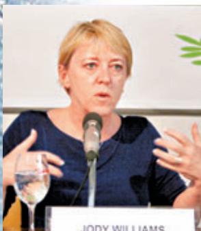
美國的喬迪·威廉姆斯