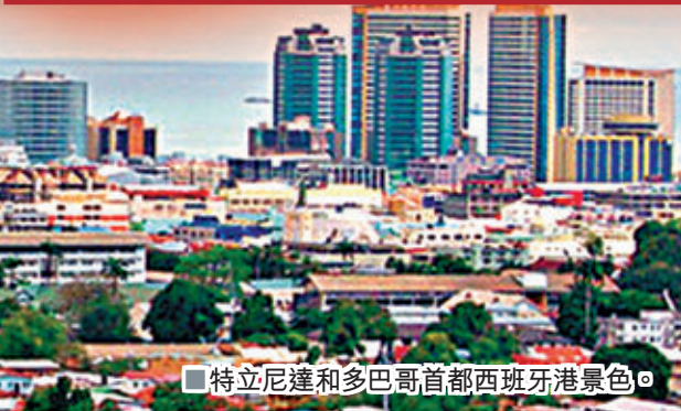
■特立尼達和多巴哥首都西班牙港景色。