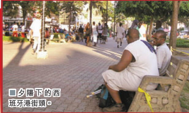
□夕陽下的西班牙街頭。