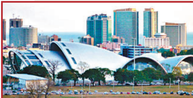
■西班牙港音樂廳美輪美奐。