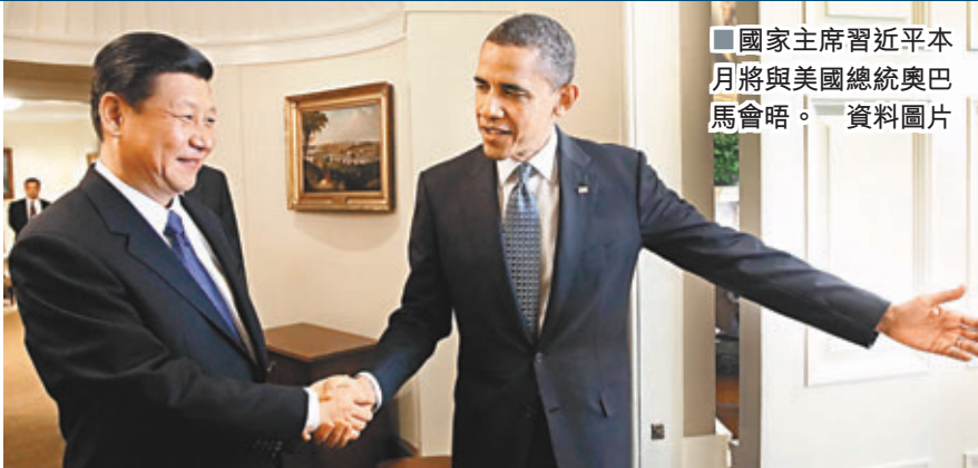
■國家主席習近平本月將與美國總統奧巴馬會晤。 資料圖片

香港文匯報訊 國家主席習近平6月初將與美國總統奧巴馬在加州會晤。美國媒體高度關注，評論家要求奧巴馬面對習近平時「不要鞠躬，要提要求」。