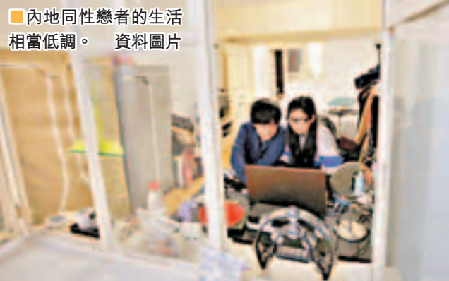
■內地同性戀者的生活相當低調。 資料圖片

承認同性戀者的結合為婚姻，賦予同性伴侶與異性伴侶相同的法律地位、權利。目前歐洲的荷蘭和西班牙、美洲的加拿大和美國麻薩諸塞州通過同性婚姻立法，在這些國家和地區，同性伴侶可申領結婚證，具有婚姻名義。