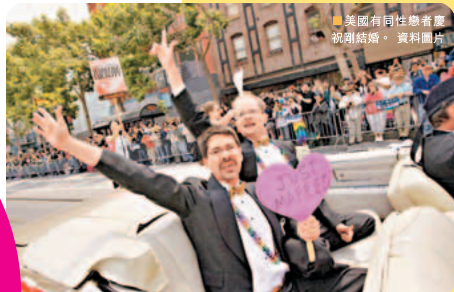
■美國有同性戀者慶祝剛結婚。 資料圖片

目前內地社會的主流觀念仍不認同同性戀現象，要將同性戀婚姻合法化將面對很大難度。但這不意味內地政府不應立法保障同性戀群體的權利。譬如，當局應制定專門針對同性戀群體權益保障的單行法律，如修改刑法關於性犯罪的若干規定，以保障同性戀者的人身權；又如制定反歧視法和同性戀者權益保護法，通過對歧視者予以相應制裁來保障同性戀者的平等權益，強調對同性戀者的尊重。