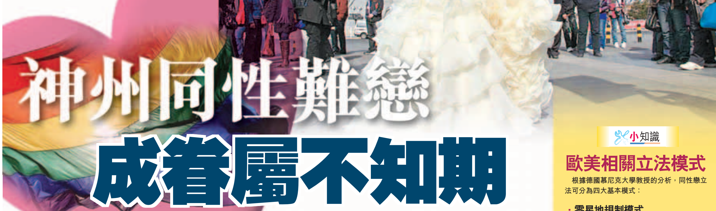
■雖然內地同性婚姻未合法化，但這對女同志仍無懼眾人目光，舉行「另類」婚禮。 資料圖片

陳振寧 ：一國兩制研究中心研究員。亞太國際關係學會成員。定期於香港《成報》、《香港商報》發表評論文章。曾參與《通識詞典3》的撰寫工作。 電郵：jambon777@yahoo.com.hk