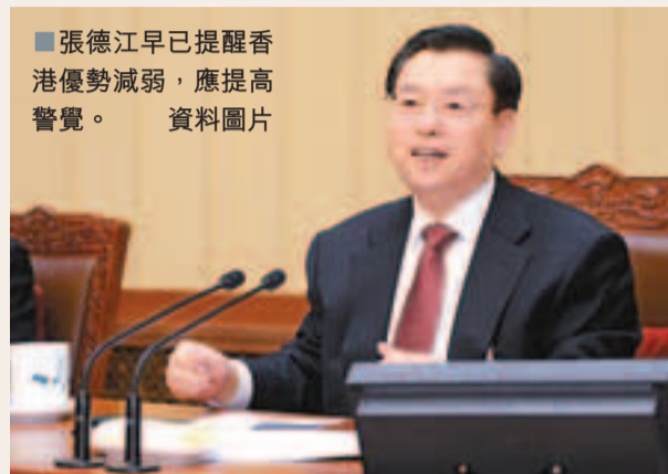
張德江早已提醒香港優勢減弱,應提高警覺。