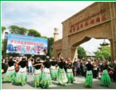
■ 伊寧市喀贊其民俗旅遊區