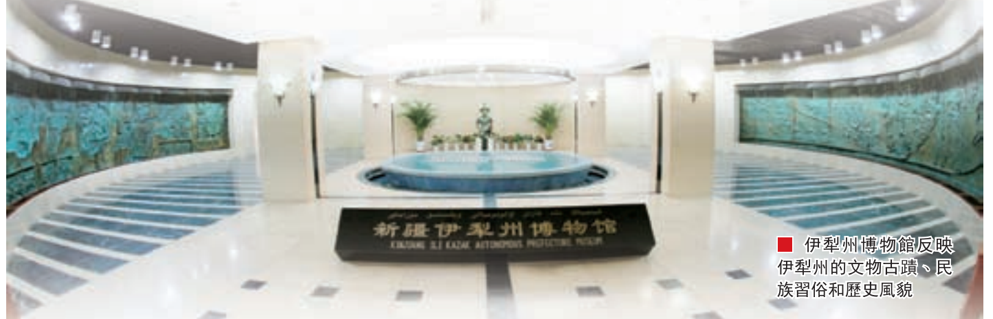
■ 伊犁州博物館反映伊犁州的文物古蹟、民族習俗和歷史風貌