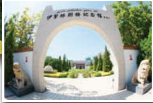
■ 林則徐紀念館記錄了林則徐在新疆伊犁時期所做的貢獻

伊寧市是中國最西部的城市，區域總面積775平方公里，現有55萬人口，維、漢、哈、回、蒙、錫伯等47個民族在這兒和睦為鄰，在繼承和保持各自民族文化傳統和特色的同時，又與時代發展的大潮相互交融，逐漸形成了獨具特色的異域民族風情。