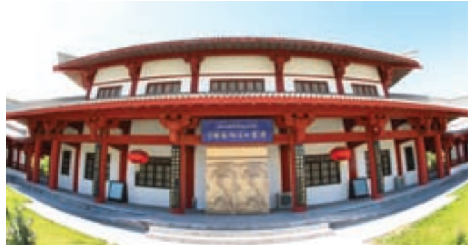
■ 漢家公主紀念館是紀念中國歷史遠嫁和親第一人——細君公主對新疆的歷史貢獻

未來3-5年，伊犁河水資源和景觀資源將被最大限度地加以利用，56公里景觀大道、伊犁河森林公園等公共設施建設正在加速推進；與此同時，綠化城市周邊大環境，實施了綿延上百公里的綠色生態長廊工程，伊寧市整體環境將更加親近自然，宜居宜業。在不遠的將來，一個民族的、現代的、國際的伊寧將以其美輪美奐的城市風貌、完善的基礎設施和多元文化的特質，廣納四海遊人，八方賓朋！