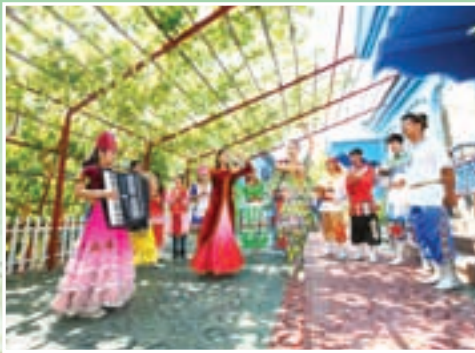
■ 美麗的姑娘們載歌載舞歡度節慶