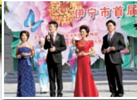
■ 伊寧市首屆民俗文化節

邊境名城——伊寧市是祖國西部邊陲的一座花園城市，北倚天山雪峰，南臨悠然西去的伊犁河，四周是美麗的西部大地，擁有一望無際的草原和神秘的森林。她坐落於有着亞歐大陸乾旱地帶「濕島」、「塞外江南」、「中國新天府」之美稱的伊犁河谷中部，這裡藍天碧野，果木繁盛，雨雪豐沛，四季分明。奔騰的伊犁河水自東向西穿城而過，溫潤的海洋季風吹沐全城。福水暖風，潤物無聲，優越的自然條件加上精心雕琢的城市環境，使這座傍水之城享有「花城」、「蘋果城」、「白楊城」、「塞外明珠」等諸多美名。