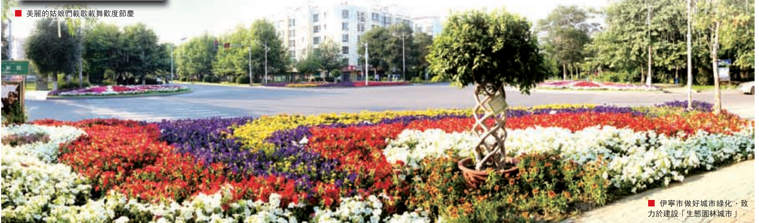
■ 伊寧市做好城市綠化，致力於建設「生態園林城市」。