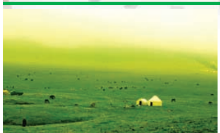
■ 雨後的那拉提大草原