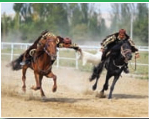
■ 「亮馬杯」賽馬運動會