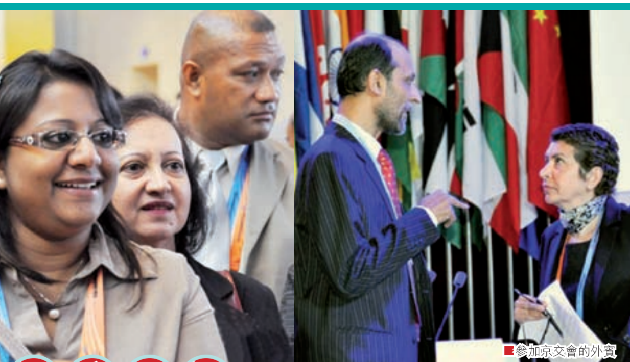
參加京交會的外賓