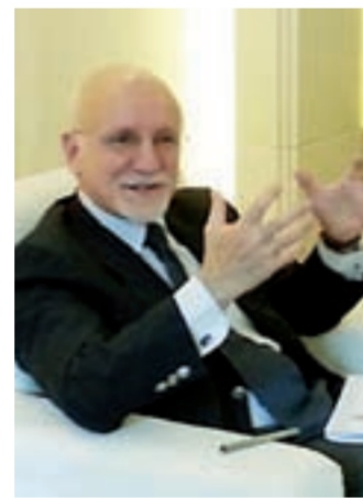
聯合國貿易和發展會議貨物及服務貿易及商品司司長瓦雷斯

在全球經濟普遍低迷的當下,中國存在兩點優勢:政府的戰略眼光,豐富的人力資源。此外,因為中國人口眾多,伴隨教育事業的廣泛普及,公民受教育程度也逐年提高,這些都成為服務業快速發展的基礎。因此可以預見,服務貿易將成為中國下一個潛力巨大的經濟增長點。目前很多服務都是以外來投資的形式存在,全球40%的外來直接投資都屬於服務領域。因此,中國發展國際服務貿易不僅會對本國經濟作出貢獻,也有利於全球發展。