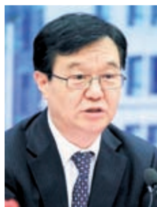
商務部部長高虎城

商務部積極推動內地與香港的經貿交流與合作,特別是推動內地與香港服務貿易自由化,目前有關工作取得了積極進展。李克強總理曾在香港宣佈,到「十二五」末,內地將對香港基本實現服務貿易自由化。本屆政府已就CEPA的落實和對香港服務業的開放等議題進行了多次研究,目前這項工作取得了積極進展,我們完全有信心實現李總理提出的目標。商務部將繼續支持內地企業把香港作為「走出去」的平台。兩地企業共同「走出去」開拓國際市場大有可為,我們應當積極創造條件。