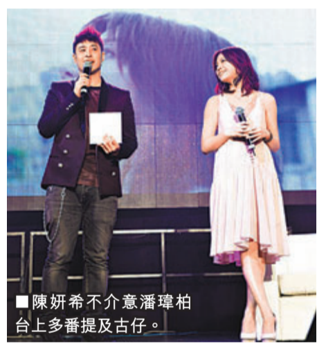
陳妍希不介意潘瑋柏台上多番提及古仔。方在智利居住也有傳來短訊支持。妍希把公開演唱的頭湯湯給香港歌迷，她相信台灣歌迷不會投訴，因已計劃在下月9日在台灣舉行音樂會。

周導新片《天台》女主角終曝光 周傑倫 (圖右) 昨日為其第二部執導的作品《天台》在北京舉行發佈會，被周導「藏嬌」已久的女主角李心艾 (圖左) 也終於揭開神秘面紗亮相。這位佳人在周傑倫的迎接下以「格林女孩」的姿態幸福「嫁」到快樂《天台》，也預示着愛情元素是這部電影的一道主菜。另外，《天台》獲選為今年紐約亞洲電影節開幕影片，也將於7月在北美國地區上映。