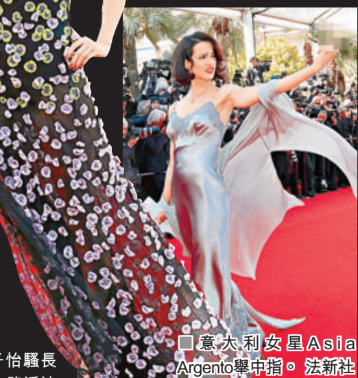
■奧瑪花曼風騷送飛吻。 ■意大利女星Asia Argento舉中指。