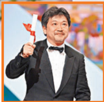
■是枝裕和興奮到高舉證書。

為期12日的第66屆康城影展已於昨日落幕，賽前法籍突尼斯導演Abdellatif Kechiche執導的女同志愛情故事法國片《Blue is the Warmest Colour》在官方場刊上以3.6分高踞榜首，該片亦以大熱姿態成功摘下最高榮譽的金棕櫚獎，成為首部同志電影拿下金棕櫚獎，Kechiche領獎時，獲兩位女主角Lea Seydoux和Adele Exarchopoulos連環送吻祝賀。而中國導演賈樟柯執導的《天注定》雖然失落大獎，但精彩的劇情令他獲頒最佳劇本，他很開心找到知音，稱獲獎代表了中國人生活面臨的困難得到世界的關注。