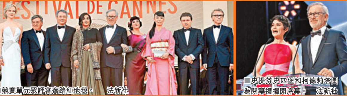
■史提芬史匹堡和柯德利塔圖為閉幕禮揭開序幕。 法新社 ■競賽單元評審齊聚紅地毯。 法新社

今屆康城影展打破傳統，首次將金棕櫚獎頒給同志片，金像導演史提芬史匹堡率領8位評審會見傳媒，稱全片一致通過由《Blue is the Warmest Colour》摘下金棕櫚獎，大讚該片描寫了一段美麗的爱情外，亦傳遞出正確的訊息予觀眾。史匹堡也對賈樟柯編寫的《天注定》讚不絕口，並指中國將會愈來愈強。