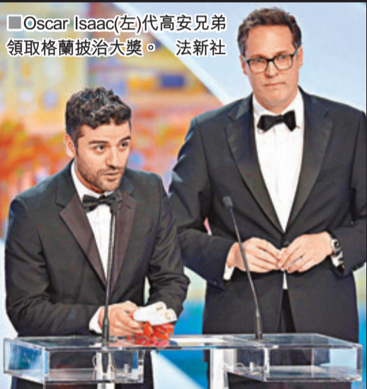
■Oscar Isaac(左)代高安兄弟領取格蘭披治大獎。