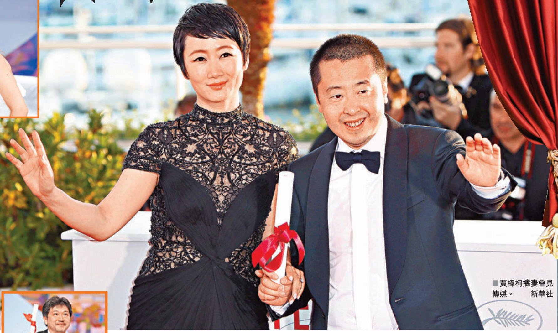
■賈樟柯攜妻會見傳媒。