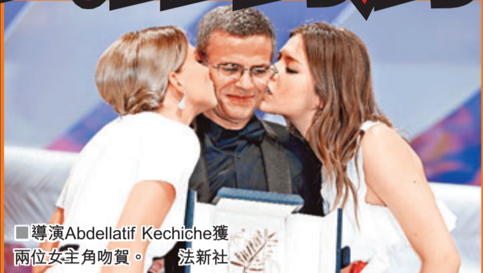
■導演Abdellatif Kechiche獲兩位女主角吻賀。