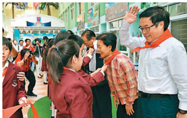
全國政協常委、港澳台僑委員會主任楊崇匯戴上紅領巾，向愛迪學生行少先隊隊禮。

楊崇匯希望從愛迪學校走出去的學生，首先要具備愛國主義的情懷，然後要有紮實的知識，有開拓創新的精神。楊崇匯表示，相信愛迪教育集團，在未來實現中華民族偉大復興的中國夢當中，做出越來越大的貢獻。希望愛迪國際教育集團能夠不斷的總結積累經驗，越辦越好，辦成一所提供優質教育的品牌名校。北京市政協副主席沈寶昌致辭時說，愛迪學校的辦學理念是富有遠見的，課程設置和教學管理適合當今時代對人才培養的需求。祝願我們愛迪學校能夠順利、大踏步的發展，也祝願我們愛迪學校培養的學生將來能夠成為社會的棟樑之才。