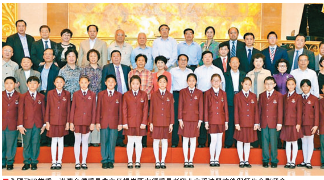
全國政協常委、港澳台僑委員會主任楊崇匯率領委員考察北京愛迪學校後與師生合影留念。