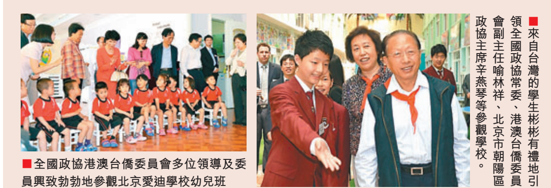
全國政協港澳台僑委員會多位領導及委員與致勃勃地參觀北京愛迪學校幼兒班。

愛迪教育集團即將落戶上海奉城。在這塊熱土上興建包括幼兒園、雙語小學、雙語初中以及國際高中的上海愛迪學校。