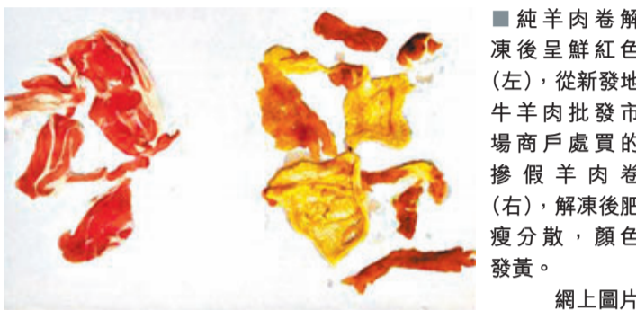
■純羊肉卷解凍後呈鮮紅色(左),從新發地牛羊肉批發市場商戶處買的摻假羊肉卷(右),解凍後肥瘦分散,顏色發黃。