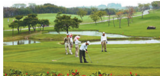
■內地一名高爾夫球俱樂部職員稱，以個人名義辦理會員卡需要交納65萬元的入會費。資料圖片

香港文匯報訊 據新華網報道，記者在採訪中發現，一些政府官員以「會員」身份出入於包括餐飲、休閒娛樂和私人會所在內的高檔消費場所，相對隱秘地進行奢侈消費，已經顯現出了一種新型的「會員卡腐敗」。