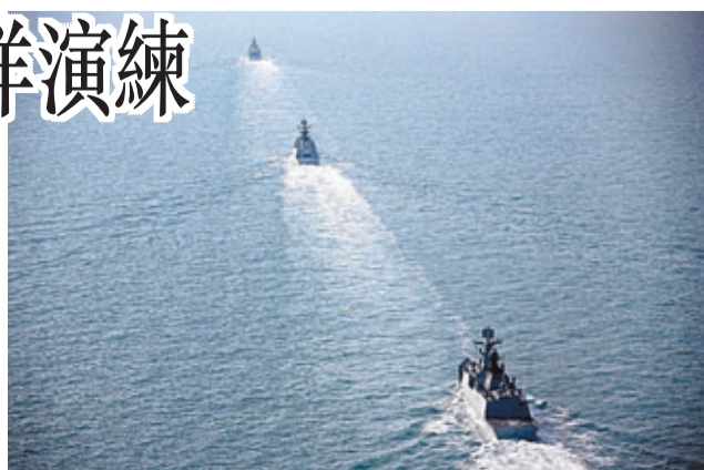
■北海艦隊3艘軍艦昨日通過宮古島東北約110公里處海域，向太平洋方向行駛。圖為早前北海艦隊駛離青島某軍港的情形。資料圖片

此次遠海訓練是北海艦隊2013年度例行性軍事訓練的一部分，也是中國海軍遠海訓練常態化的體現。