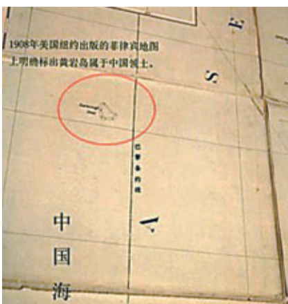
■1908年美國紐約出版的菲律賓地圖，上面用國界線以及「中國海」的文字等方式標明，被稱作「Scarborough Shoal」的黃岩島屬於中國。網上圖片

香港文匯報訊 據環球網報道，古地圖收藏家、南海問題研究學者真誠先生首次向記者展示了一張1908年美國紐約出版的菲律賓地圖，上面用國界線以及「中國海」的文字等方式標明，被稱作「Scarborough Shoal」的黃岩島是屬於中國的。