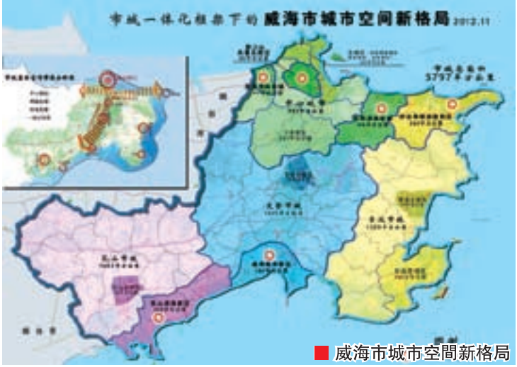
■ 威海市城市空間新格局

香港回歸十幾年間，特別是近幾年來，威海和香港的經貿合作日益深入。截止目前，威海現存香港投資企業230家，實際使用港資存量為11.8億美元，佔全市的31%。其中，2012年新批香港投資企業21家，兩地的貿易額突破3.4億美元。