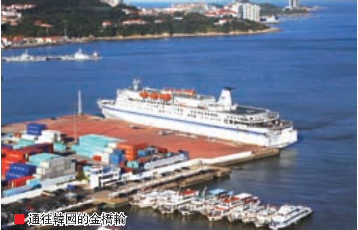
■ 通往韓國的金橋輪