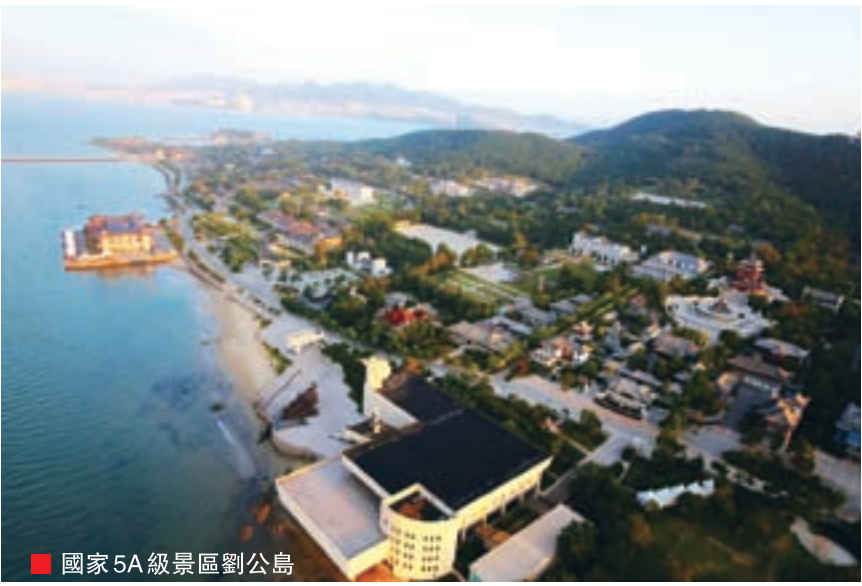
■ 國家5A級景區劉公島