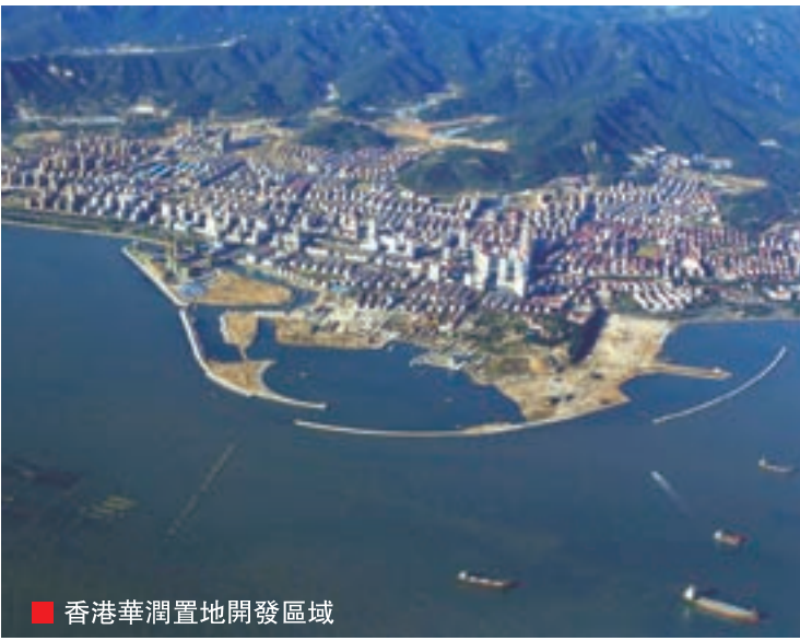
■ 香港華潤置地開發區域