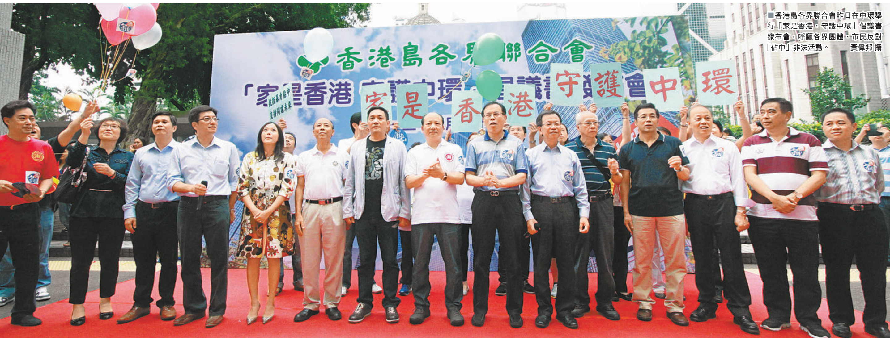
香港島各界聯合會昨日在中環舉行「家是香港」守護中環倡議書發布會,呼籲各界團體、市民反對「佔中」非法活動。