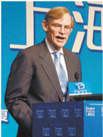
前世界銀行行長佐利克。

現任哈佛大學貝爾弗科學與國際事務中心、彼得森國際經濟研究所高級研究員的佐利克，過去兩天出席了上海復旦大學的對話會及「2013年上海論壇」開幕式。佐利克在會上指出，中國是一個崛起中的大國，而美國則是已經崛起的大國，目前這兩個國家都是非常成功的經濟體，在它們各自的區域中，與其他國家也有非常緊密的關係，所以中美間的關係，必然會影響到全球的態勢。