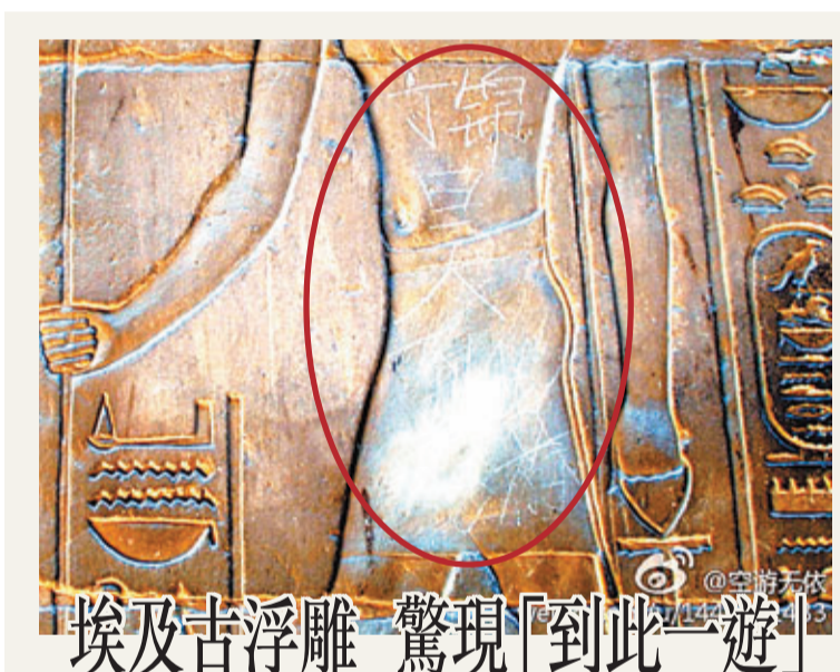
埃及古浮雕 驚現「到此一遊」

崔天凱進一步指出，未來10年，中美完全可以從自身發展和經濟結構調整中尋找更多、更大的合作機遇，在綠色能源、環保、氣候變化、基礎設施、推進全球經濟治理改革等方面挖掘新的合作潛力，不斷提升中美經貿合作的水平。中美經貿關係在發展過程中存在一些摩擦與矛盾是完全正常的，雙方應通過對話協商妥善處理，絕不能將經貿問題政治化。