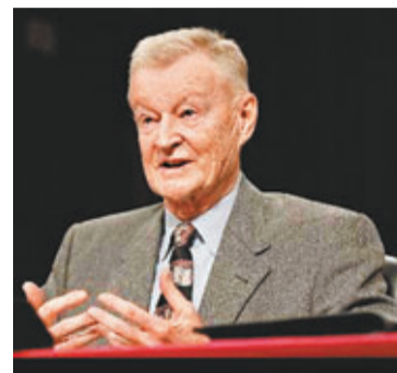
美國前總統卡特的國家安全事務助理布熱津斯基。網上圖片

香港文匯報訊 美國前總統卡特的國家安全事務助理布熱津斯基昨日在《人民日報》發表題為《中美合作有益於世界》的文章，稱中美合作有益於世界，還就美國總統奧巴馬的「重返亞太」作出了解釋。