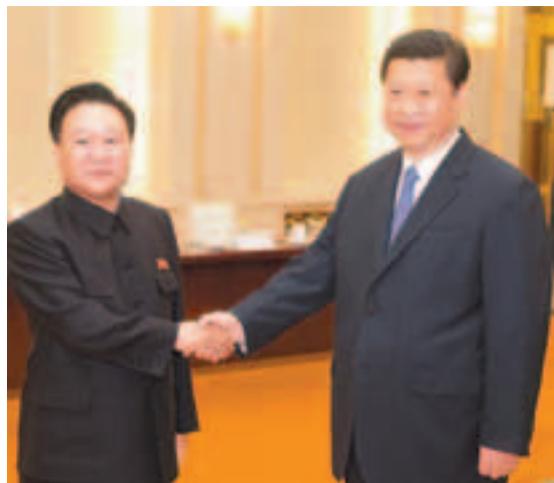
■習近平在人民大會堂會見朝鮮勞動黨第一書記金正恩特使、朝鮮勞動黨中央政治局常委崔龍海。