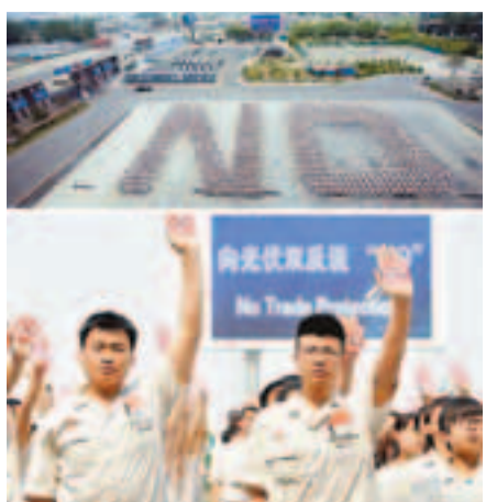
■中國的光伏企業——英利園區千名員工擺成一個大大的「NO」(上圖)表達對歐盟「雙反」的反對。

與會光伏企業代表表示，自2012年9月6日歐委會正式發起反傾銷調查以及11月8日發起反補貼調查後，150多家光伏企業對調查本身給予了充分的配合，以期歐委會能夠得出公正的結論。但今年4月底，歐委會一如既往地拒絕了所有中國企業的市場經濟地位申請，而其拒絕的理由中很重要的一點是認定中國企業沒有一整套符