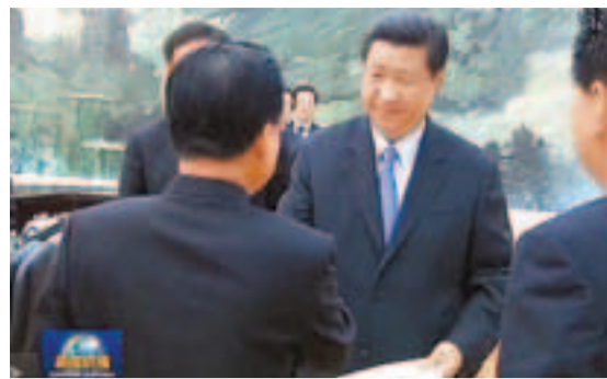
■習近平接收崔龍海遞交的金正恩親筆信。

崔龍海表示，朝方十分珍惜朝中傳統友誼，願與中方一道，加強高層交往與深度溝通，不斷鞏固和發展朝中友好關係。崔龍海說，朝方真誠希望發展經濟，改善民生，需要營造和平的外部環境。朝方願與有關各方共同努力，通過六方會談等多種形式的對話協商妥善解決相關問題，維護半島和平穩定，朝方願為此採取積極行動。