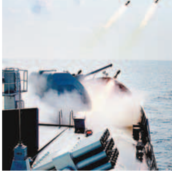
日前，海軍南海艦隊某驅逐艦支隊協同航空兵、潛艇以及後勤等單位，開赴陌生海域，開展實戰化對抗訓練。