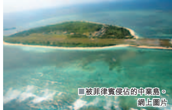
被菲律賓佔領的中業島。

記者：在南海問題上，美菲等國一直試圖拉東盟介入，將問題擴大化和國際化，他們會得逞嗎？