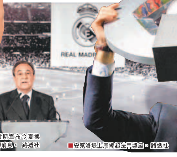
佩雷斯宣布今夏換教練的消息。