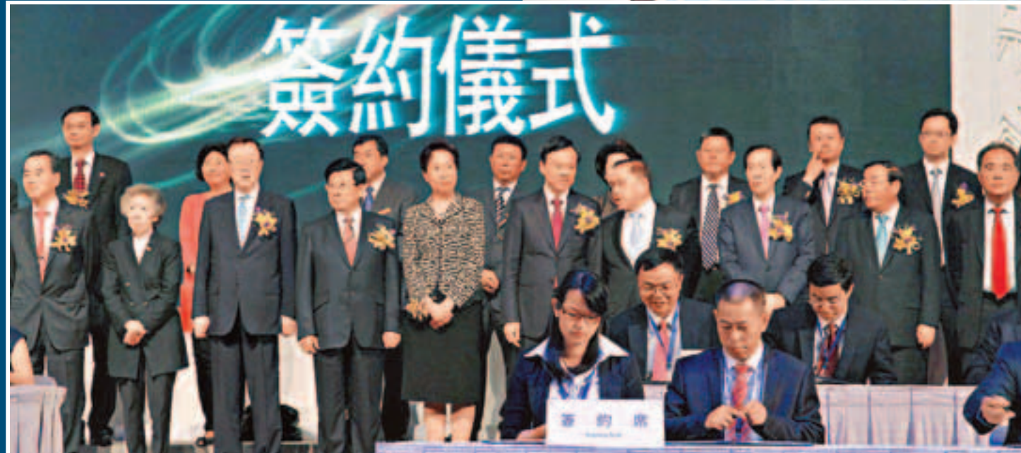
開幕式現場簽約60個項目，涉資262億美元。