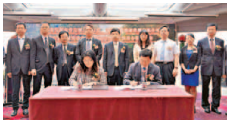
香港駿新能源集團與安順普定縣簽署合作意向書。

據了解，雙方合作始於今年4月15日，安順市在香港舉辦「瀑鄉安順·投資熱土」招商引資推介活動，駿新能源被普定縣優質的煤層賦存條件所吸引，經過前期緊張的合作洽談、現場考察、可行分析，駿新集團終決定投資普定。安順市市長王衛君則表示，將在政策優惠、行政服務等方面給予企業大力支持，盡快推動項目落地生根，產生經濟和社會效益。