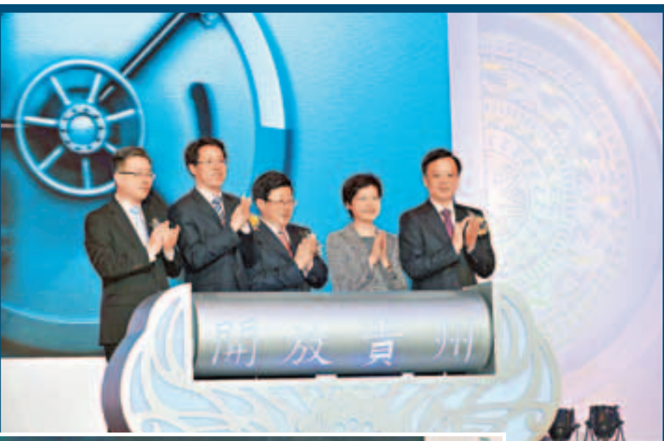
圖左起：外交部駐港特派員宋哲、香港中聯辦主任張曉明、貴州省委書記趙克志、香港特區政務司司長林鄭月娥、貴州省長陳敏爾共同啟動開幕式。