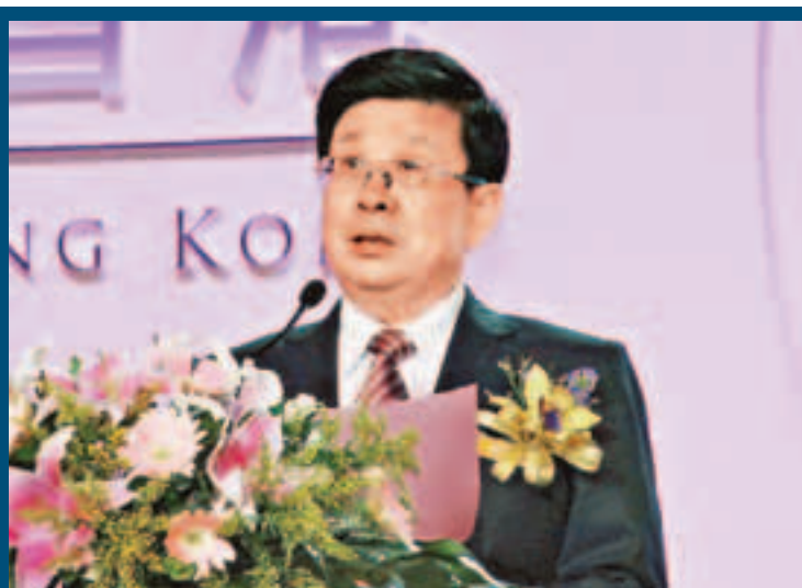
趙克志表示，貴州·香港投資貿易活動周已成為貴州擴大對外開放的重要窗口。

貴州省長陳敏爾介紹，貴州是全國礦產資源大省之一，全省已發現礦(含亞礦種)128種，其中儲量居全國前5位的達28種。汞、鋁、磷、煤、錳、鎢、金是貴州的七種代表性礦產。能源工業的迅速發展為貴州磷化工、鋁加工等優勢資源產業發展創造了良好條件。