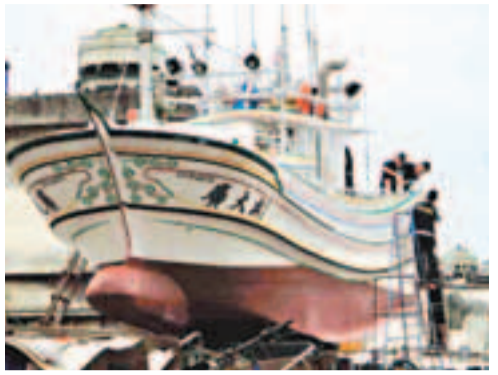
遭菲律賓公務船射擊的「廣大興28號」。資料圖片

香港文匯報訊 據中通社報道，針對菲律賓指稱台漁船日前遭菲律賓公務船掃射，是因其侵入菲領海所致。台灣「農委會漁業署」昨日公佈事發當天「廣大興28號」的航程紀錄器(VDR)，航跡資料顯示廣大興一直都在台灣的專屬經濟海域內作業，並未進入菲律賓領海，反駁菲方指「廣大興28號」曾關掉航程記錄器的說法。「漁業署」呼籲菲國勿再扭曲事實。