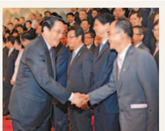
中共中央政治局常委、全國政協主席俞正聲(前排左)與台商代表握手。

香港文匯報訊 據中央社報道，台灣「外交部」發言人高安昨天說，歡迎菲律賓願與台灣談漁業合作。據菲媒報道，菲律賓總統阿基諾三世昨日對當地媒體表示，考慮與台灣方面洽談有關漁業合作事宜，以避免日後漁船事件重演；另一方面也可促進區域和平和繁榮。高安受訪時表示，菲律賓尚未透過馬尼拉經濟文化辦事處方面正式表達這方面的訊息，「外交部」持續查證中。她表示，台菲啟動漁業談判，對於未來防範類似「廣大興28號」不幸事件再度發生，有極大正面意義存在。