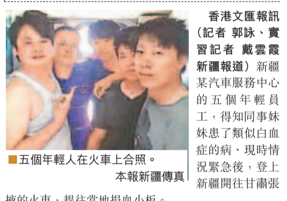
五個年輕人在火車上合照。

香港文匯報訊 (記者 郭詠、實習記者 戴雲霞 新疆報道) 新疆某汽車服務中心的五個年輕員工，得知同事妹妹患了類似白血症的病，現時情況緊急後，登上新疆開往甘肅張掖的火車，趕往當地捐血小板。