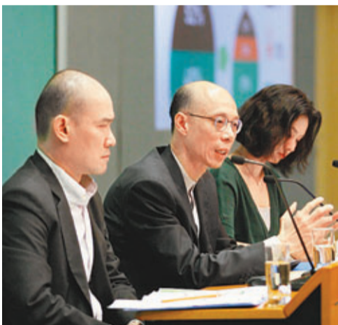
環境局前日發表「資源循環藍圖」，圖為黃錦星於會上發言。