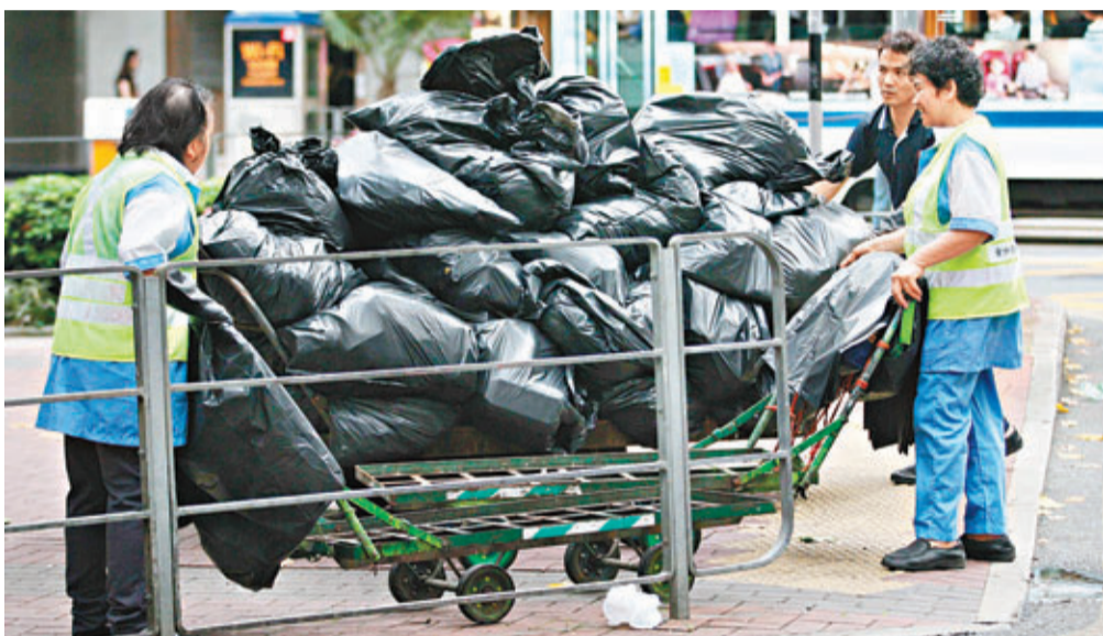
本港垃圾徵費水平明年將有結果。