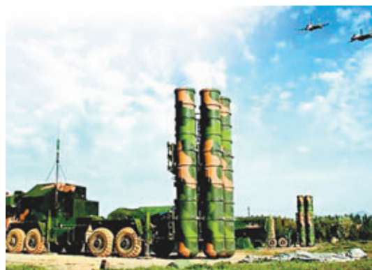
廣空駐鄂防空旅所有導彈營已全部換裝紅旗-9型防空導彈。

另據《解放軍報》報導，空軍某演習場，兩個新裝導彈營近日接受了空軍戰備值班考核驗收。考核中，官兵們個個動作嫺熟，技術精湛，順利通過考核驗收，這標誌著國產某新型防空裝備整建制形成作戰能力。今年初，隨著最後兩個導彈營完成換裝任務，空軍某旅整建制列裝國產某新型防空裝備(紅旗-9型防空導彈)。不久，這兩個導彈營又受命赴西北執行軍事演習的任務。