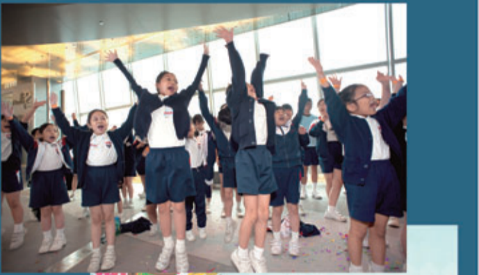
參加藝術教育講座的小朋友在導師的悉心指導下，學習以簡單樂器及手腳拍出音樂節拍，同時配合身體動作自創別開生面的舞蹈。