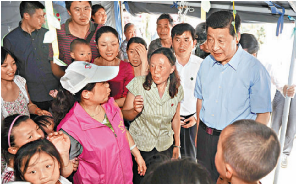
習近平(右一)昨日在蘆山地震災區安置點看望帳篷幼兒園的孩子們。

隆興中心校是汶川地震香港特區政府援建項目。昨日，習近平還到該校查看災區孩子們的上學情況。由於臨近「六一」兒童節，習近平向這裡的孩子們送上節日的祝福，祝孩子們節日快樂。一名男孩表示，他想像科學家，建造會飛的房子，這樣就能免受災難危害。習近平說：「青少年要敢於有夢。從西遊記到凡爾納科幻小說，飛船、潛艇今天不都有了嗎？有夢想，好好讀書，才能夢想成真。」習近平強調：「不管是什麼情況，不論是什麼天