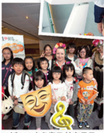
近300名兒童及其家長早前觀賞香港藝術節表演，並與國際藝術家會面。

「眼見面前這班學生看演出時的投入和參與，是任何表演者夢寐以求的100分觀眾，他們的手舞足蹈帶領著全場的氣氛。希望可以繼續見證這班小孩子的成长，配合適當的栽培，也許他們會是下一代的藝術家。」