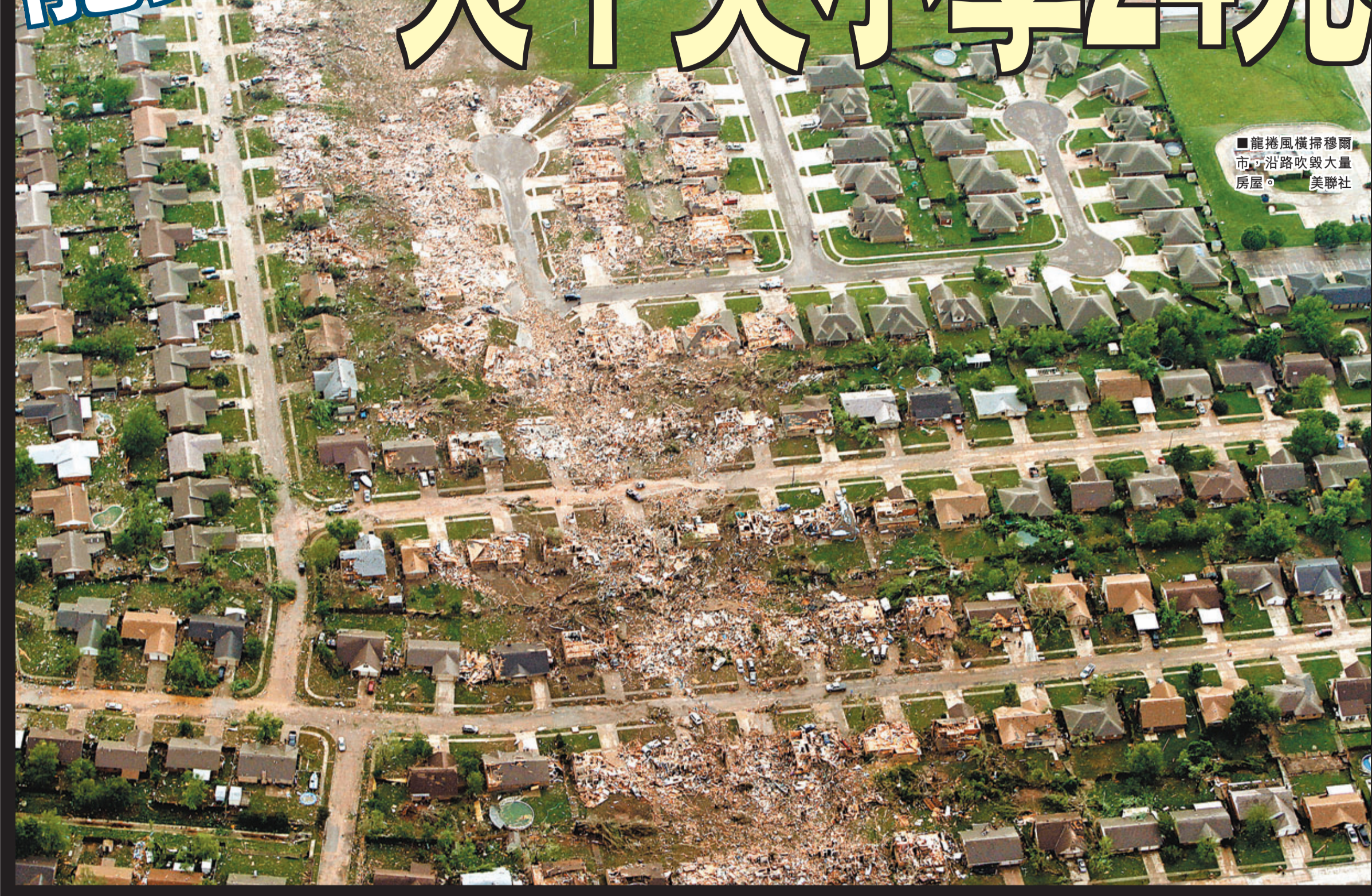
龍捲風橫掃穆爾市，沿路吹毀大量房屋。