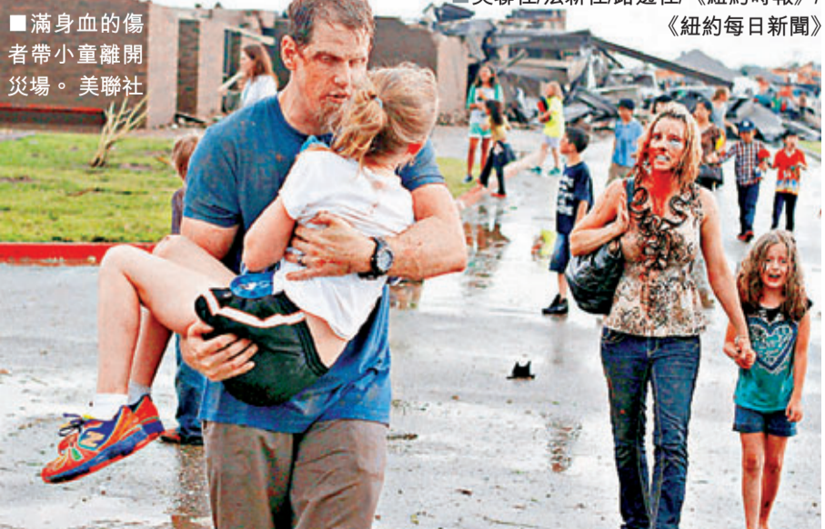
滿身血的傷者帶小童離開災場。