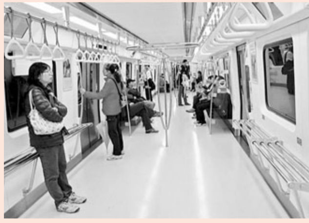
■車廂寬敞，設有簡易靠位。

一個還不是樞紐的台大醫院站，其內外標識圖竟然做到這樣的精緻，我不由得十分驚嘆。上海地鐵站點周邊現正在抓市容環境治理。我有次問一個地鐵執勤人員：地鐵出口站外面的標識，為甚麼一塊也沒有？他茫然地答：地鐵內不是有了嗎？！