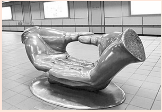
■台大醫院站站的雕塑座椅，造型別致。

簡政放權 人稱全球貨幣幣一觸即發？其實，在我看來貨幣幣戰已因美、日、歐狂印鈔票，多個國家減息之行動而拉開戰幕。