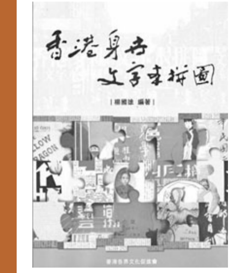
■本書輯有楊國雄的報業研究。

近水樓台先得月，楊國雄充分利用了吳瀾陵所藏資料，但坊間當無從一睹，怪不得他希望「孔安道紀念圖書館可以調配足夠的資源，從促將這些資料整理妥當，使有志研究香港報業史者，得以利用吳氏歷年盡心盡力所收集的史料。」筆者亦翹首以望焉。