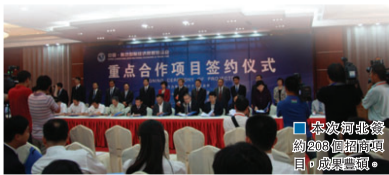
本次河北簽約208個招商項目，成果豐碩。

香港文匯報訊(記者孔榮娣 廊坊報道)中國民營500強高端會議暨「百家民企進河北」合作項目懇談會舉辦期間，聯想、新希望、廣度控股、大連萬達等148家中國民營500強企業前來考察對接。河北省書記周本順表示，環渤海、京津冀地區已成為繼