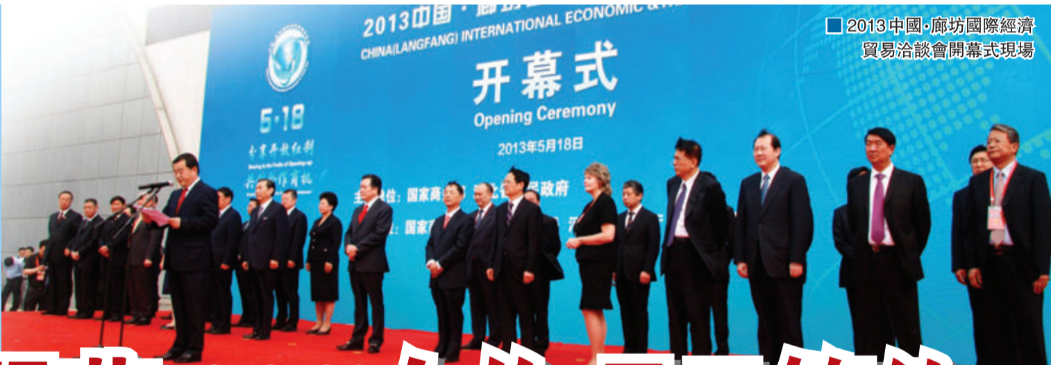
2013中國·廊坊國際經濟貿易洽談會開幕式現場