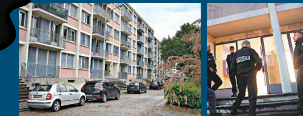
冷血父親在寓內殺害子女。圖為發生兇案的大樓。

法國上周末發生倫常慘案，48歲的英國裔無業男子，割喉殺害分別年僅10歲及5歲的女兒，其後踩滾軸溜冰(Roller)逃走，最終落網。他昨日提堂時承認犯案，檢察部尚未起訴他謀殺罪。疑犯有家暴前科，早於2、3年前與法裔妻子離婚，希望爭取子女撫養權。警方正調查行兇動機。