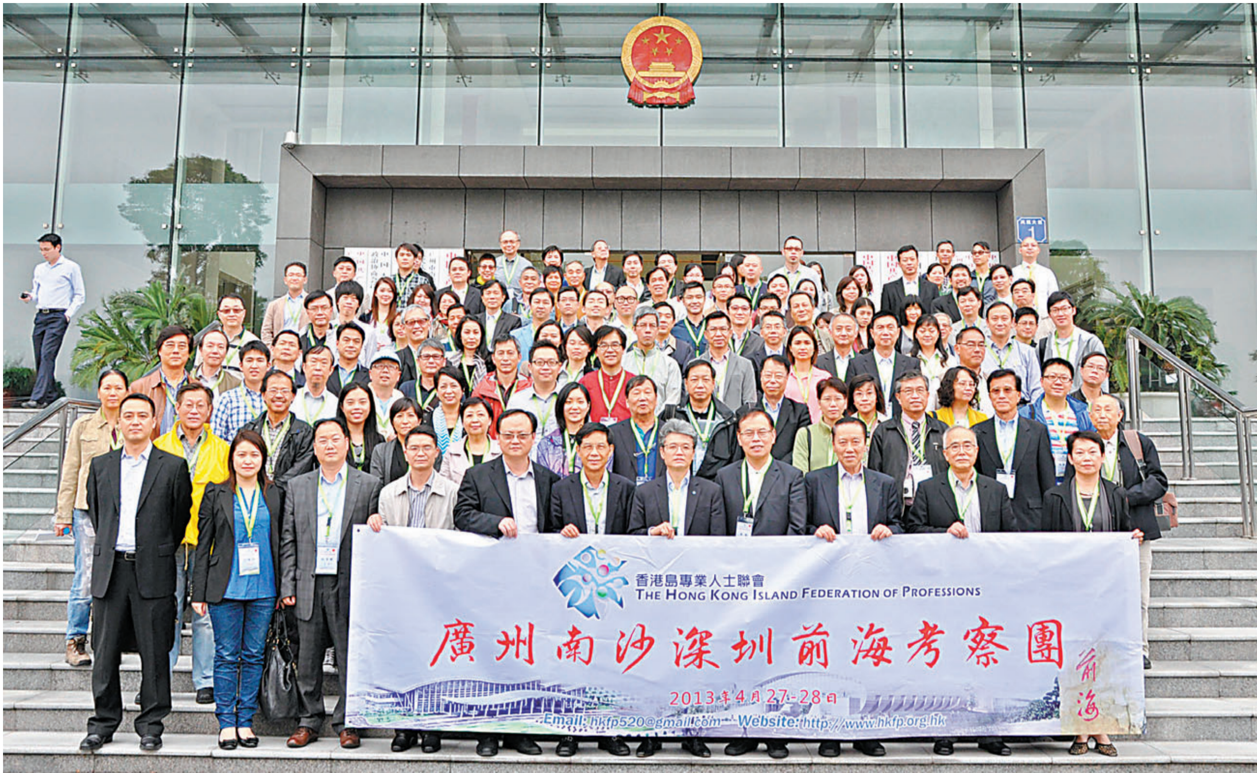
4月27日，香港島專業人士聯會廣州南沙深圳前海考察團前往南沙市政府與各部門交流探討南沙新區總體城市規劃、經濟定位、特殊政策優惠及稅制優惠，考察團成員於南沙市政府大樓前合影。