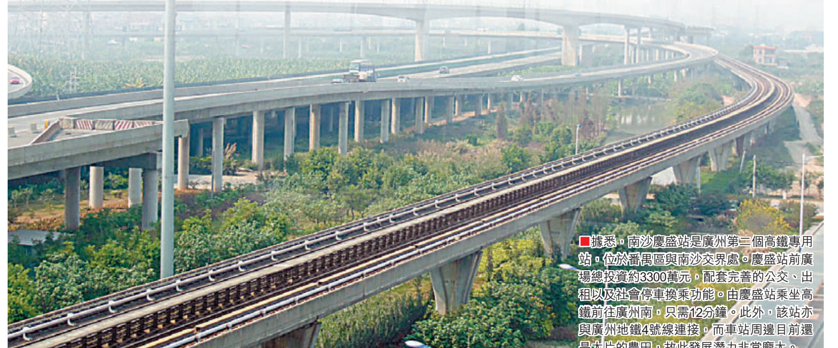
據悉，南沙慶盛站是廣州第三個高鐵路站，位於番禺與南沙交界處。慶盛站前將興建投資約3300萬元，配套完善的公交、出租以及社會停車場等設施。由慶盛站乘坐高鐵路前往廣州市區，只需12分鐘。此外，該站亦與廣州地鐵4號線連接，而車站周邊目前還是大片的農田，故此發展潛力非常龐大。