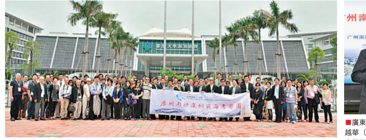
考察團在香港大學深圳學院大樓前合影。