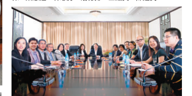
香港島專業人士聯會幹事成員。