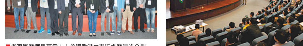
考察團醫務專業人士參觀香港大學深圳醫院後合影。

今年，該會將集中資源進行下列項目：一、協助本地的傷健人士融入社區，尤其關注傷健人士社區設施的配套以及就業發展機會。二、向社區以及老人院舍派發環保袋，藉以灌輸環保概念。三、組織香港及內地學生交流活動，讓他們拓展視野，互相學習，學會感恩。四、支援中國內地醫護人員的培訓，提升他們的專業素養。未來，他們仍會繼續集思廣益，為業界與政府及內地的溝通橋樑。又不定期舉行研討會及活動，為業界帶來第一手的行業資訊，扶助業界發展，並通過該會與內地的緊密聯繫，協助會員拓展業務，提升香港專業人士的競爭力，為業界謀求福祉。