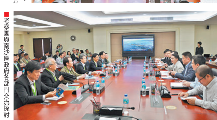
考察團與南沙市政府各部門交流探討。

為進一步緊密香港與廣東服務業合作，4月27日至28日，香港島專業人士聯會考察團133人前往南沙及前海實地考察，並在區政府與各部門交流探討兩個地區的總體城市規劃、經濟定位、特殊政策優惠及稅制優惠。考察團一行表示，南沙新區建設蓄勢待發、規劃科學，他們將以這次訪問為契機，抓住穗港深化合作的重重大機遇，進一步加強與南沙相關行業的合作交流，投資興業，為粵港合作做出努力。