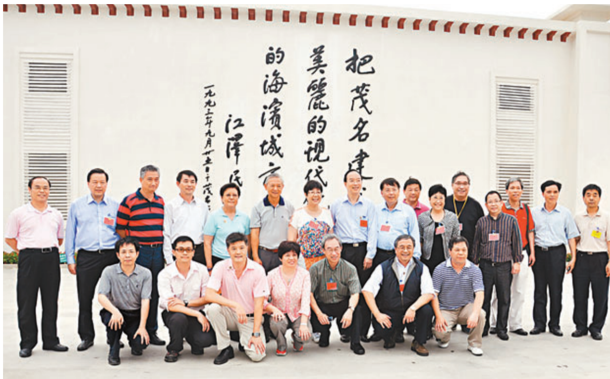
■考察團參觀「茂名濱海公園」。香港文匯報記者黃斯昕 茂名傳真

考察團今晨將出席座談會，聽取茂名市政府介紹經濟社會發展情況。同日下午，考察團將離開茂名，轉赴湛江市。