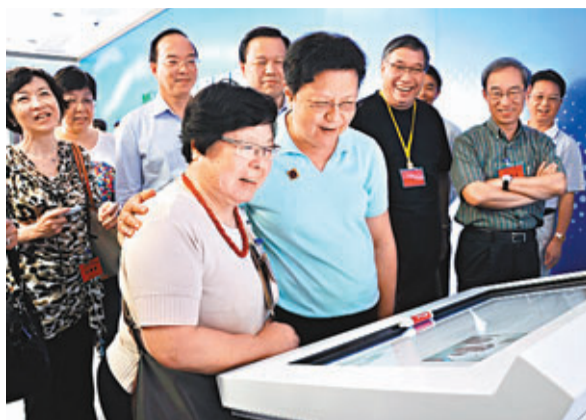
■考察團聽取簡介，並即席拍照留念。香港文匯報記者黃斯昕 茂名傳真

「高州市根子鎮真園」始建於隋唐，是內地歷史最悠久、面積最大、保存最完好、老荔枝樹最多、品種最齊全的古荔園之一。園中樹齡逾500年的荔枝樹有39棵，被視為「荔枝博物館」；「紅荔園」亦被定為「廣東省愛國主義教育基地」。2000年，時任中共中央總書記、國家主席、中央軍委主席江澤民親臨視察，親手在園中種下一棵「中華紅」荔枝樹。