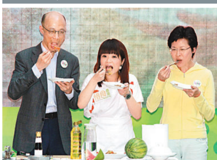
■林鄭月娥(右)和黃錦星(左)試食以西瓜皮作食材的菜式，宣傳減少廚餘的訊息。

香港文匯報訊（記者 羅繼盛）現時每日被運往堆填區的廢物中，40%屬於廚餘。為增加社會對廚餘問題的關注，政府昨日啟動「惜食香港運動」，包括推行《惜食約章》，並會招募惜食大使進行宣傳，期望可在3年內減少10%廚餘量。政務司司長林鄭月娥表示，減少廚餘是本屆政府環保政策中的重點工作。