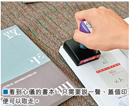
■看到心儀的書本，只需要說一聲，蓋個印便可以取走。