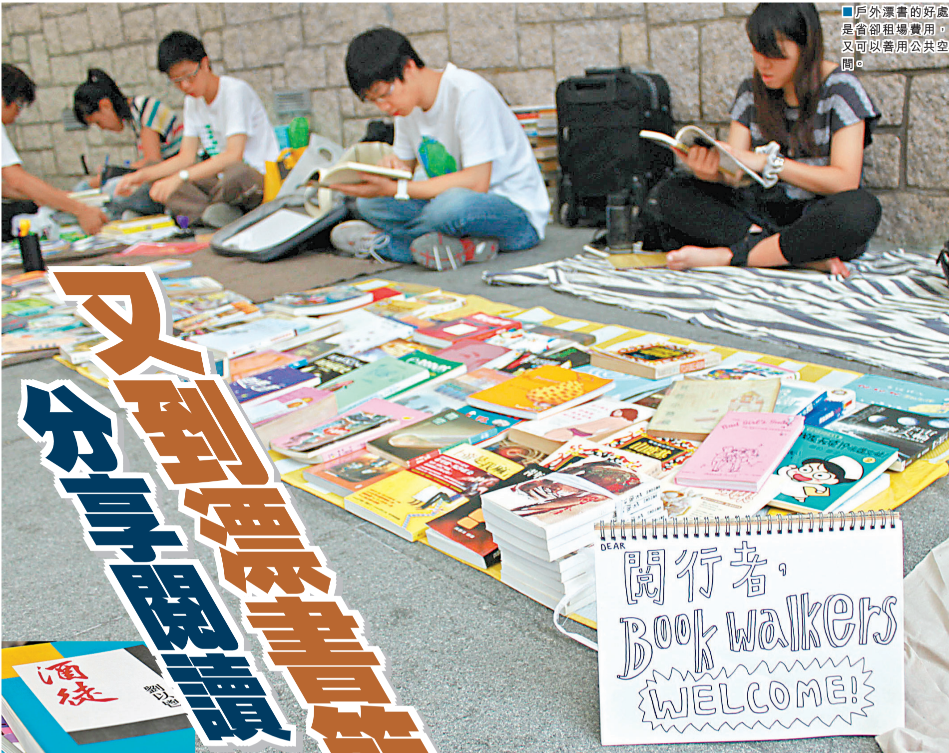
■戶外漂書的好處是省卻租場費用，又可以善用公共空間。