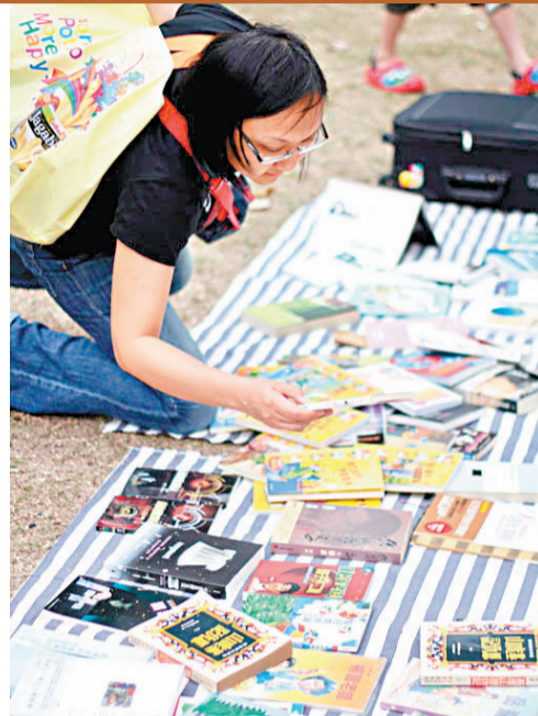
■大家拿出來放漂的大多是流行讀物、繪本。

日期：5月19日 15:00-17:30 地點：香港兆基創意書院 *活動將於室內舉辦，但租場要成本，主辦單位會設入場費，參加者衡量價值後，可自行定立費用。