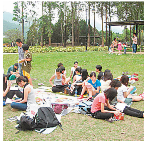
■草地是最好的漂書空間，坐着躺着趴着，想在上面打滾也可以。