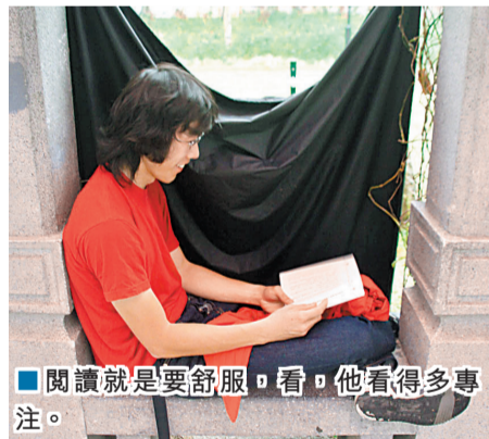
■閱讀就是要舒服。看，他看得多專注。

早於上世紀二、三十年代，歐洲已有漂書(Bookcrossing)的概念。人們將不再閱讀的書貼上標籤，投放在公共場所，其他人遇到合適的書，取之閱讀後，按照書上的標籤，以同樣的方式漂出去。書上的標籤寫着漂書的規矩，最初是漂書人在看完書後必須寫下感想、閱讀筆記等，後來玩法愈來愈多，大家都在漂書時設定不同的規矩，漂書的過程愈來愈豐富。