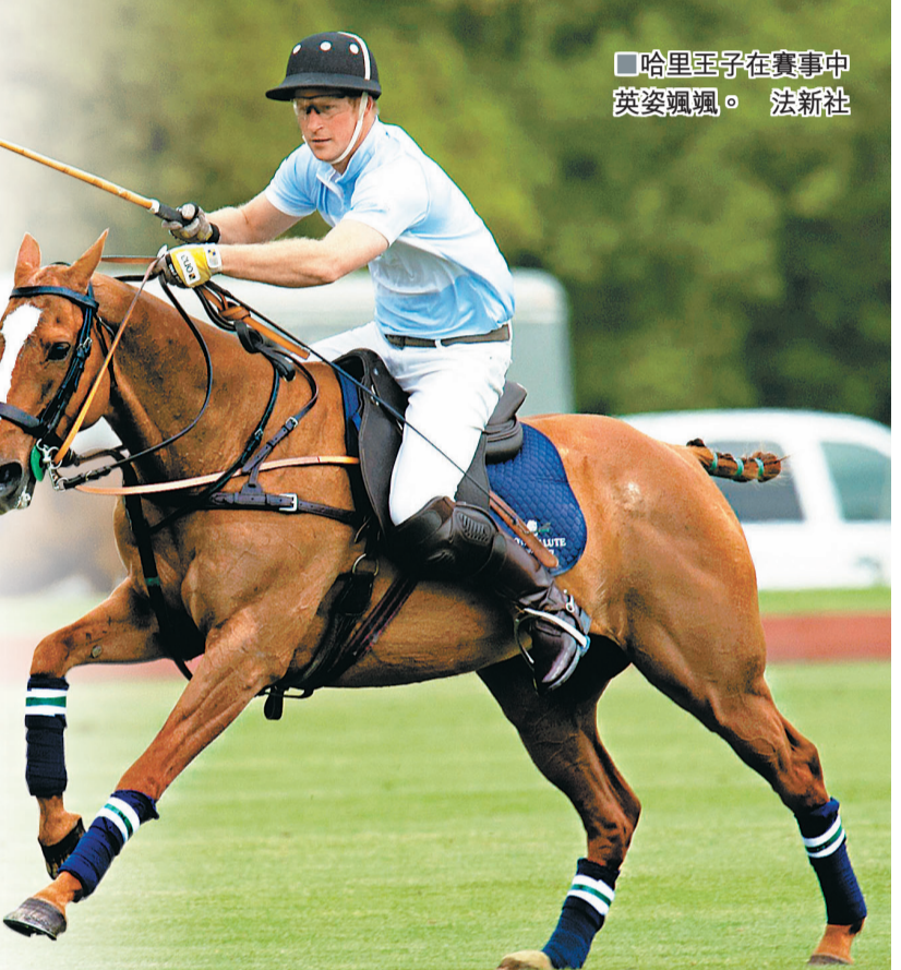
哈里王子在賽事中英姿颯爽。