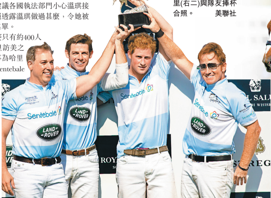
勝出比賽後，哈里(右二)與隊友捧杯合照。