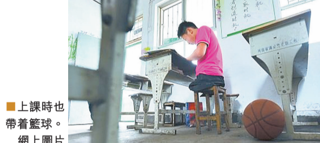
上課時也帶著籃球。