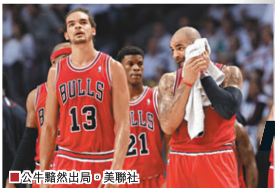
■公牛黯然出局。