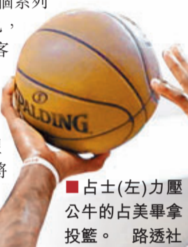
■占士(左)力壓公牛的占美畢拿投籃。