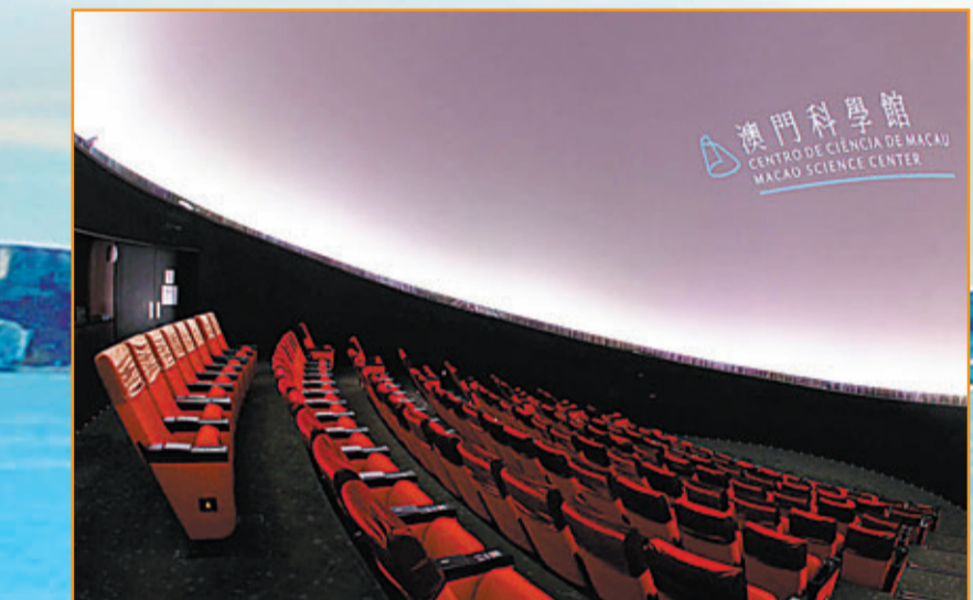
■澳門科學館天文館天象廳的高解像度立體數碼放映系統，是全球首個同時具備超高清和立體視覺效果兩項強大功能的設施。