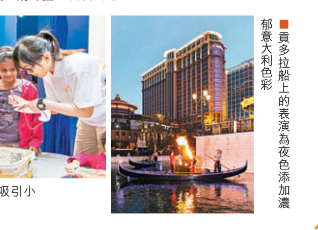
■傳統意大利面具及面部彩繪吸引小朋友的目光

由即日起至5月26日，「澳門威尼斯人嘉年華」滿載意大利水鄉濃厚節日氣氛及色彩，載譽歸來，連續第三年登陸澳門。 「嘉年華大匯演」每年都是嘉年華焦點活動，今年亦不例外，將被熱鬧繽紛的意大利嘉年華色彩所包圍。由即日起至6月2日，長達10分鐘的「威尼斯之奇妙面紗」大型3D光效投影匯演將在每晚7時30分至10時，於澳門威尼斯人的戶外湖畔區每兩小時將會為小朋友及愛侶們締造甜蜜夢幻的體驗。此外，飛天舞蹈、水上滾球、貢多拉之旅、傳統意大利面具及面部彩繪、華麗樂隊上貼上浪漫留言，意大利玻璃吹製示範等更多豐富多彩的活動等著遊客盡情歡樂。 今年嘉年華另一項盛事，便是5月23日至26日將於澳門威尼斯人的戶外人工湖畔區舉行的「澳門葡萄酒美食節2013」。接近30個攤位提供來自不同國家的美酒試飲，讓遊客在舒適的環境下一邊品嚐特色佳釀，一邊欣賞現場娛樂表演。 日期：即日起至5月26日 地點：澳門威尼斯人 免費入場