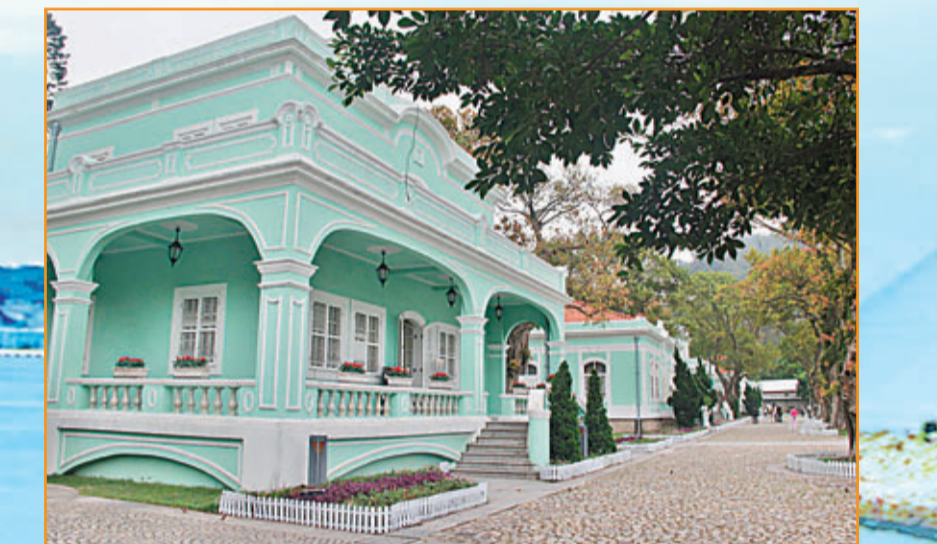
■龍環葡韻住宅式博物館是氹仔重要的文物建築與文化遺產