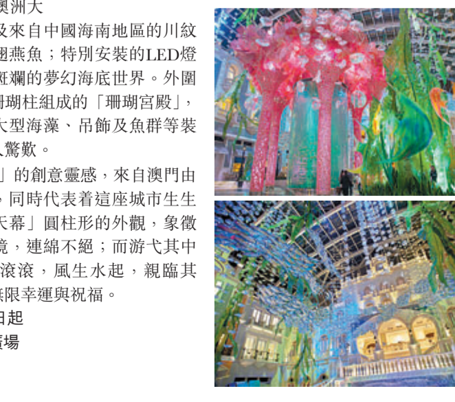
■水天幕是由六根赤紅色、高約8.5米的珊瑚柱環抱組成的海底「珊瑚宮殿」，珊瑚群組的美態盡顯眼前。

五月，開啟「美高梅奇幻光影之旅」吧！步入美高梅天幕廣場的「光·影·水世界」，親身體驗光影交織的奇妙海底世界：色彩奪目的珊瑚宮殿環抱8米高的圓柱形水底船，海洋與天空融為一體，逾千魚兒遨遊天際的奇景盡入眼簾。 位於美高梅天幕廣場中央的「水天幕」，是「光·影·水世界」的主體及靈魂，8米高的圓柱設計，採用當今一流無縫接駁技術製造，讓觀眾360度欣賞每一條魚的悠然姿態，其中包括來自澳洲大堡礁的黑鰐礁鯊以及來自中國海南地區的川紋刺魷、黃金鱈及圓翅燕魚；特別安裝的LED燈光設備，營造幽藍瑰麗的夢幻海底世界。外圍更有六根巨型赤色珊瑚柱組成的「珊瑚宮殿」，加上懸掛半空中的大型海藻、吊飾及魚群等裝置，美輪美奐，令人驚歎。 「光·影·水世界」的創意靈感，來自澳門由來已久的海洋文化，同時代表著這座城市生息不息的動能。「水天幕」圓柱形的外觀，象徵著吉祥好運永無止境，纏綿不絕；而游弋其中的魚群則寓意財源滾滾，風生水起，親臨其地，將為觀眾帶來無限幸運與祝福。 日期：2013年5月1日起 地點：美高梅天幕廣場 免費入場