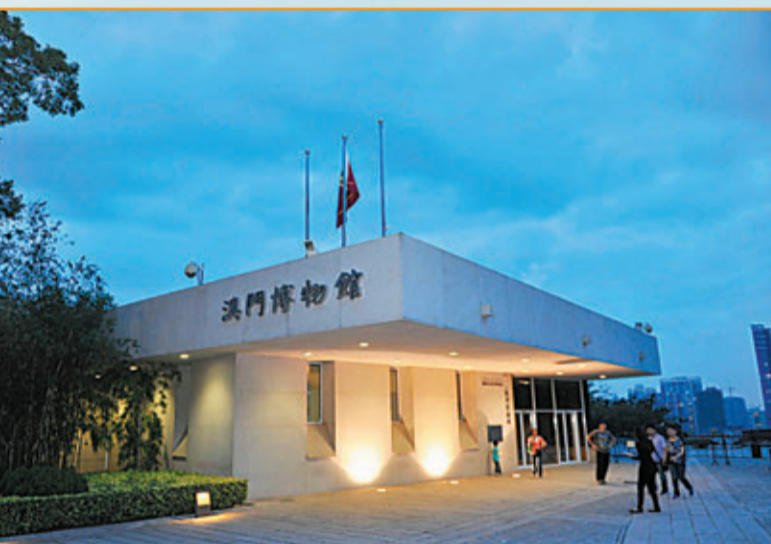
■澳門博物館坐落在澳門著名的歷史遺跡大炮台之上