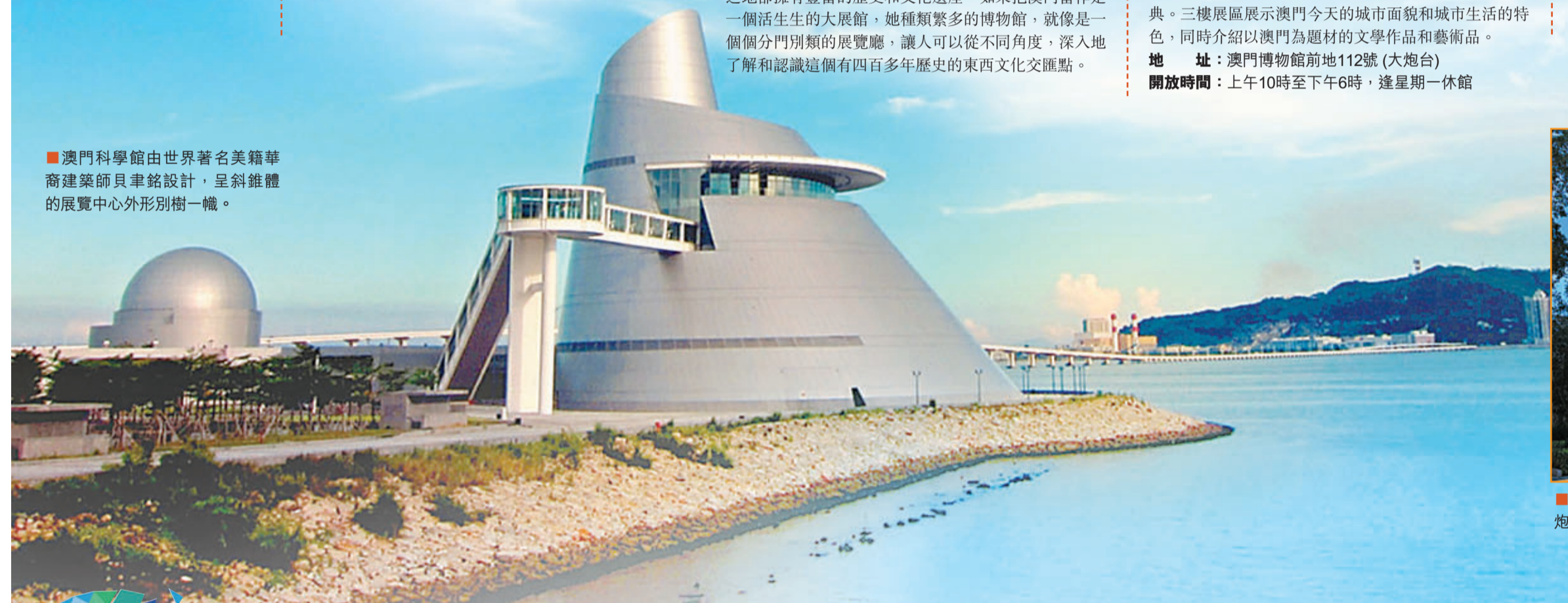
■澳門科學館由世界著名美籍華裔建築師貝聿銘設計，呈斜錐體的展覽中心外形別樹一幟。

對久在煩囂的都市人來說，土地暨自然博物館內的展品都會令人感到新奇和有趣。展館分為澳門自然地理、昔日離島農耕工具、農民勞動情況、動植物和藥用植物這五個部分。在這裡，觀眾可以對昔日農民所用的農耕工具和飼養的家禽加深認識。展品還包括大批昔日農具如水車、風扇、穀磨等，現今已甚少有人使用。 地址：路環石排灣郊野公園內 開放時間：每日上午10時至下午6時，逢星期一休館，公眾假期除外。 免費入場