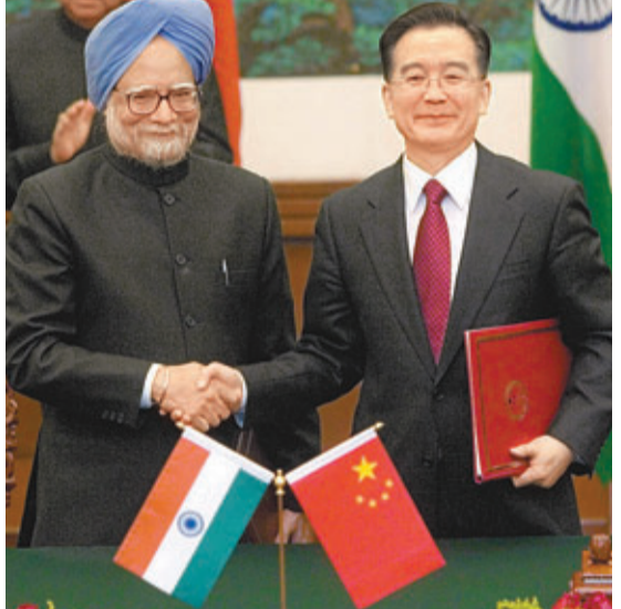
印度總理辛格2008年訪華時，與當時的溫家寶總理簽署貿易協定。資料圖片

儘管兩國間貿易額總體以擴大趨勢發展，中印兩國之間經貿關係發展並非一帆風順，此前印度商工部長夏爾瑪就表示過，印度政府對印中貿易逆差感到嚴重擔憂，印度與中國的貿易還停留在印度對中國出口原材料，再從中國進口成品的狀態。商務部數據顯示，印度對中國的貿易逆差在逐年遞增，這一數字在2012年已經達到了260億美元。沈驥如認為，貿易逆差主要還是因為兩國工業化水平