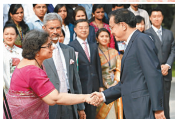
李克強總理15日在北京會見印度青年代表團。

香港文匯報訊 (記者 孟慶舒 北京報道) 隨着中國「習李」政治周期的開啟，同為新興的發展中人口大國，中印如何譜寫「龍象共舞」的新圖景，備受國際關注。應印度總理辛格邀請，中國總理李克強將從5月19日啟程正式訪問印度。新總理首次出訪，首站選擇印度，足顯中國新一屆政府對中印關係的高度重視。此間專家分析認為，李克強總理此次訪印，料給此前剛剛平息的邊境問題上「再保險」，同時通過簽署一系列合作協議，以期拓展雙方多領域的經貿合作，亦不排除就中印攜手參與國際治理秩序的改革，提出新的主張。