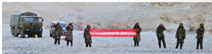
中印軍隊日前在邊境發生「帳篷對峙」事件，中國軍人展示標語橫幅要求印軍退回。資料圖片

在中國14個陸上鄰國當中，同中國確立陸上領土邊界的國家已有12個，唯剩印度、不丹兩國，遲遲未同中國就領土問題達成一致。多年來，中印兩國邊境問題談判遲遲難以取得重大突破，原因眾多。傅小強在接受媒體採訪時表示，中印邊境問題難點，就在於實際控制線難以劃定。雖然中印雙方在1993年確認雙方邊界有一條「實際控制線」，並且嚴格尊重和遵守這條「實際控制線」，但此條實際控制線在現實中卻並未完全確立，這也為中