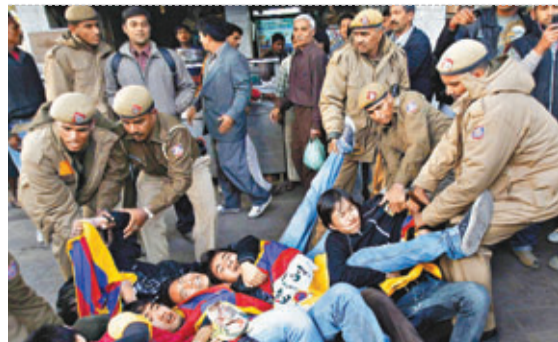
印度警方拘捕示威的「藏獨」分子。

理瓦傑帕伊訪華期間，印度宣佈承認西藏是中國領土的一部分，重申印度政府不允許流亡藏人在印度領土上從事反對中國的政治活動，這可視為印度西藏政策的積極轉向。馬加力指出，雖然印度國內仍然有某些政客利用達賴及其支持者達到某種目的，但是印度政府和不少有識之士也開始對在印度的流亡藏人產生不少擔憂。印度某些勢力確實存在某種繼續利用達賴集團為本國戰略利益服務的心理，但同時也深感發展和繼續改善印中雙邊關係的重要。此外，管理流亡藏人的問題也成為印度社會管理的「灰色地帶」，「藏獨」分子已經成為阻礙中印關係發展的絆腳石，這些顧慮也使得印度不得不重新梳理外交重點，維護中印關係大局。